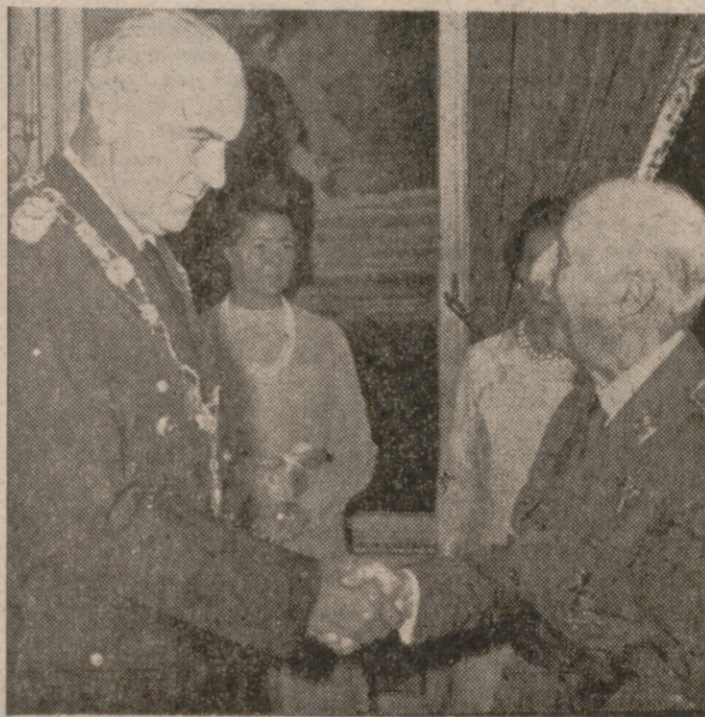
Franco y Lanusse en El Pardo, el día 24 de febrero del año en curso.

Hoy ha comenzado su visita oficial de seis días de duración el Presidente argentino Héctor J. Cámpora, a quien acompaña su esposa y un numeroso séquito, en el que están integrados varios miembros del actual Gobierno argentino.