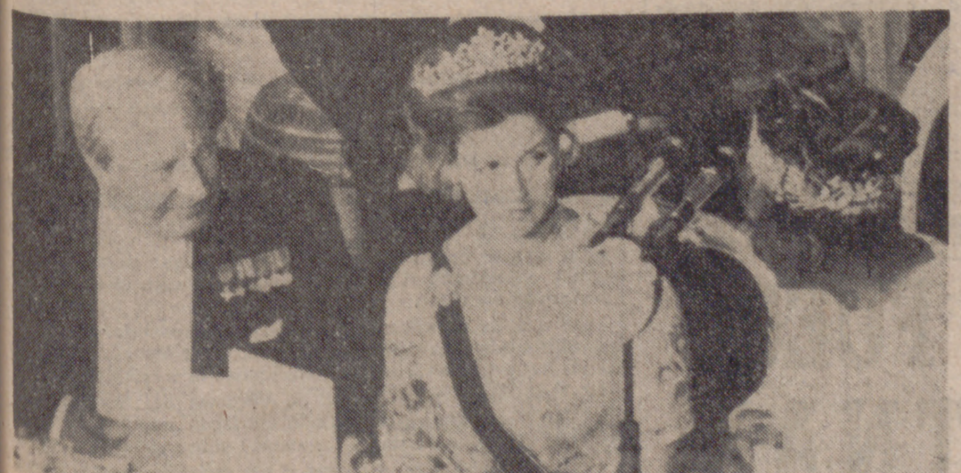
LONDRES.—El general Gowon, jefe del Estado nigeriano, conversa con la princesa Alejandra y el primer ministro británico, Edward Heath, durante el banquete que le fue ofrecido en el Guildhall.

JEFATURA PROVINCIAL DEL MOVIMIENTO FUNERAL EN EL VALLE DE LOS CAIDOS