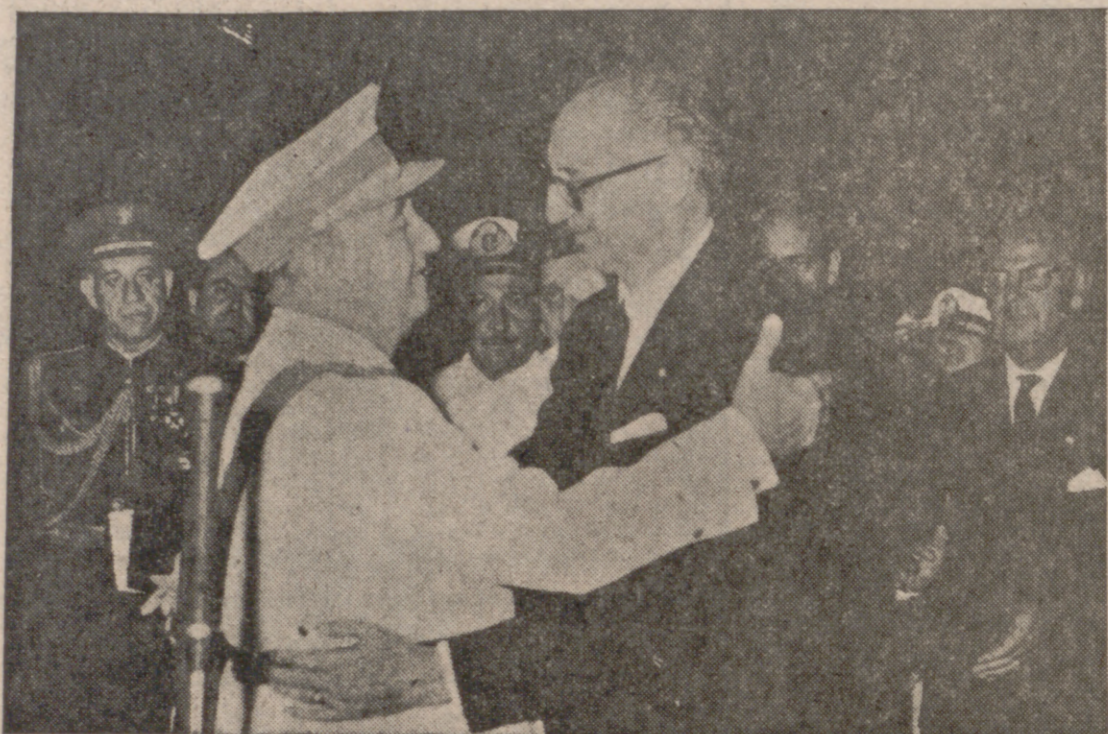
Frondizi, recibido por el Caudillo el 7 de julio de 1960.