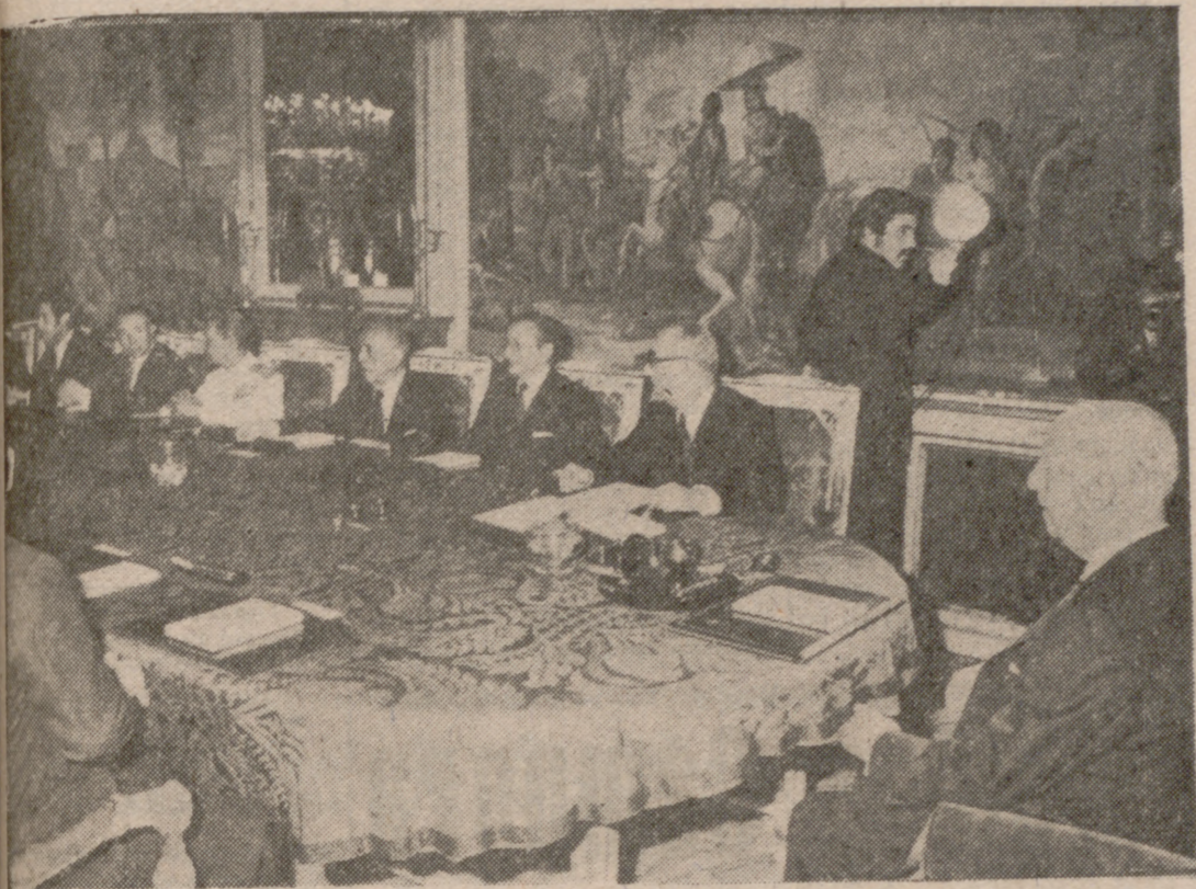
MADRID.—El Consejo de Ministros de ayer, presidido por el Jefe del Estado.

Ismael Merlo y Vicky Lagos se casaron ayer