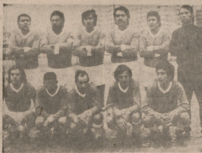
El Circular consiguió, a costa del I. N. C., la primera victoria de la Liga.

El partido más importante se disputaba en el campo de San Pedro Regalado, entre el titular y el visitante.