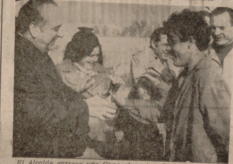
El Alcalde entrega una Copa al equipo de fútbol del Aula de Cultura del Barrio de las Flores.

barrio será concluido en el plazo más breve posible.