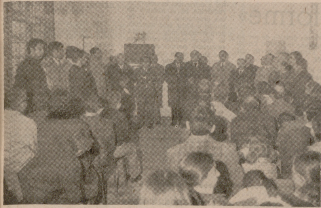
Acto inaugural en el Aula de Cultura del Barrio de los Pajarillos Altos.

En los barrios de las Flores, Belén y Pajarillos Altos