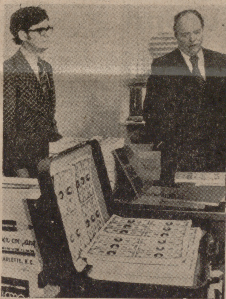
CHATTANOOGA (Tennessee).—El jefe de la Policía del distrito de Nashville, Paul Dester (a la derecha), con otro agente federal, examina los paquetes de pliegos de billetes falsos de veinte dólares y el material para su impresión, recogidos en el más importante servicio de esta clase llevado a cabo en los Estados Unidos. Los billetes falsos confiscados suman entre siete y diez millones de dólares.