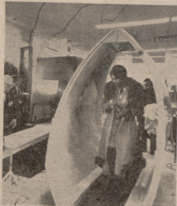
NUEVA YORK.—Una pasajera pasando por el dispositivo para la detección de metales en este aeropuerto, como una medida de seguridad para combatir los secuestros aéreos. Todos los equipajes son registrados también.