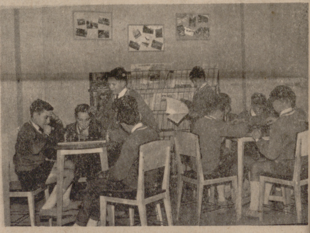
Colegio Menor, escuela de convivencia.

El personal directivo del colegio menor lo constituyen un director, un preceptor y educadores escogidos entre los propios antiguos alumnos que cursan estudios universitarios. Cuenta siempre con una Asociación de Padres de Alumnos, que es consultada a la hora de programar la temporalización de las actividades juveniles específicas: culturales, artísticas,