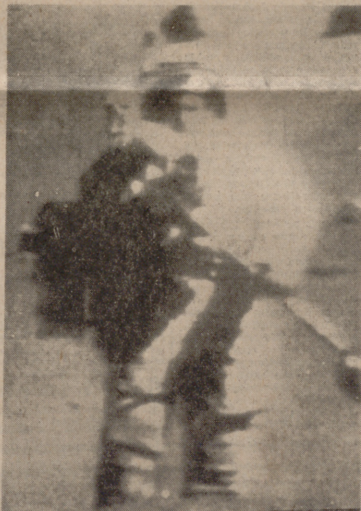
LA LUNA.—El astronauta Schmitt, en el último paseo lunar programado para la última expedición al satélite.