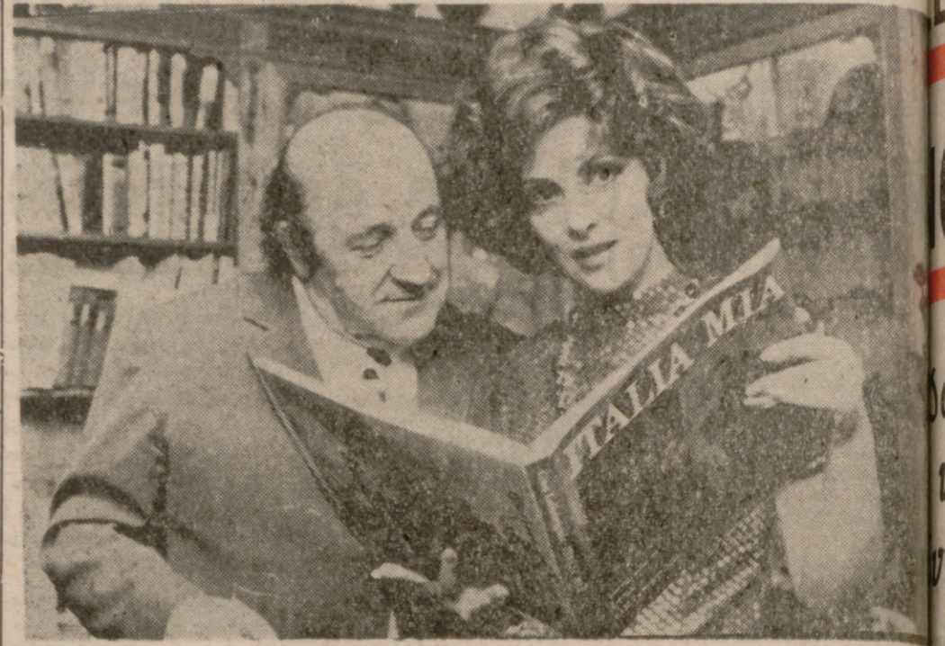
ROMA.—La actriz Gina Lollobrigida muestra un ejemplar de su libro «Italia mia» al escritor Giacomo Manzù, durante la fiesta celebrada para la presentación de la obra, que contiene cientos fotografías, tomadas por Gina en sus recorridos por el país.