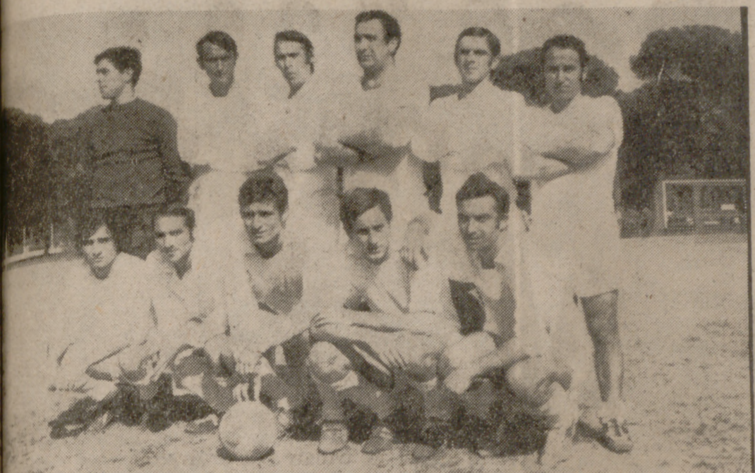
CONJUNTO DEL GRUPO DE EMPRESA FASA