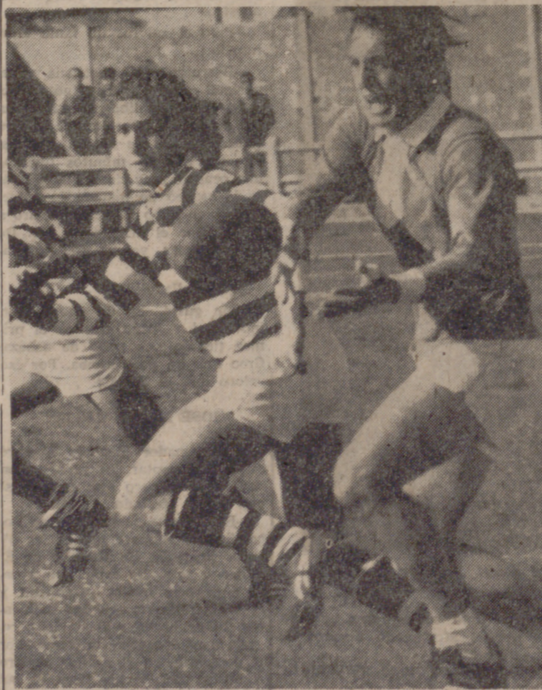
Una apertura del equipo visitante, siempre con mayor fortuna que los locales.

Contra todos los pronósticos, El Salvador ha vuelto a conocer la derrota en terreno propio, y la de ayer, frente al San Sebastián, ha sido sin paliativos, poniendo de manifiesto que algo no marcha entre las filas de los jóvenes y voluntariosos integrantes del equipo revelación de otras temporadas, finalista en la Copa de Su Excelencia el pasado año, precisamente frente a este mismo equipo, que ayer se llevó con todo merecimiento los puntos en litigio.