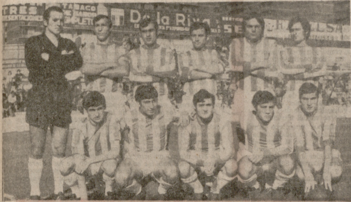
El Europa sólo pudo arrancar un punto en su desplazamiento a Burgos. El barro tuvo la culpa