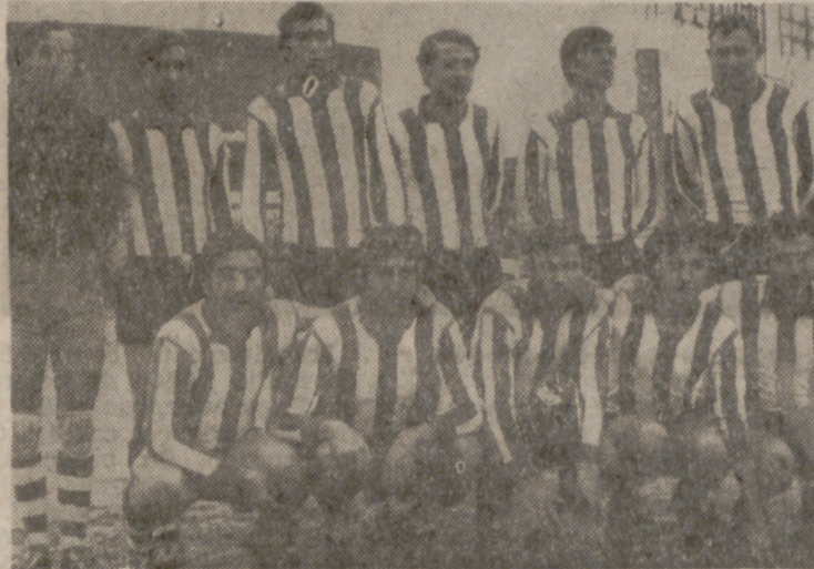
El At. Fasa se alzó con un importante triunfo sobre el Rioseco, aunque el partido no haya terminado aún.

Los partidos Ferroviaria-Circular y Sava-Betis acabaron en tablas