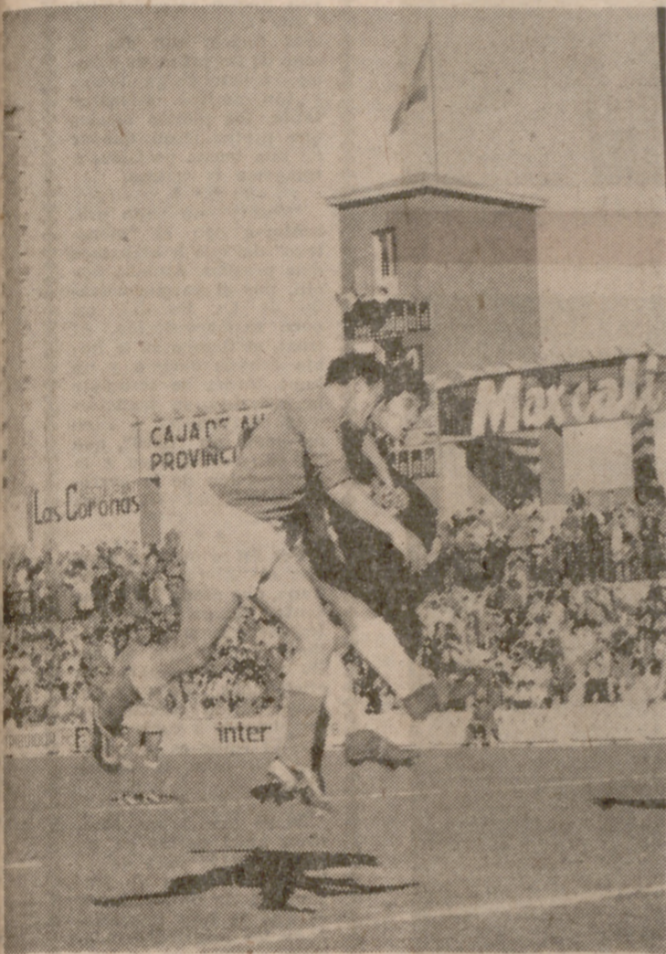
El portero visitante logra despejar de puño, anticipándose a Escudero.

Clara victoria europea en el estadio sobre el modestísimo Lacia, aunque el juego dejara mucho que desear. No es el Europa el mismo equipo alegre y potente de la primera vuelta y poco a poco ha ido perdiendo posibilidades y juego. Al menos eso parece desprenderse de su pobre rendimiento ante el flojísimo conjunto leonés, colista del grupo.