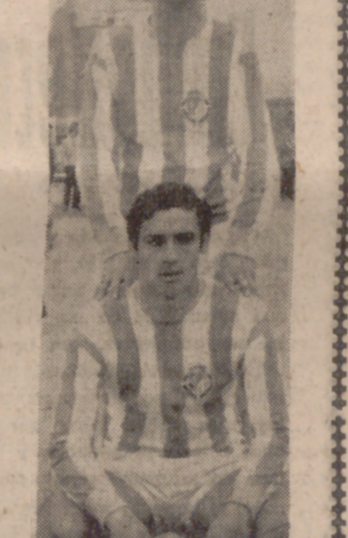
Adalía y Vaquero, medios del Real Valladolid.