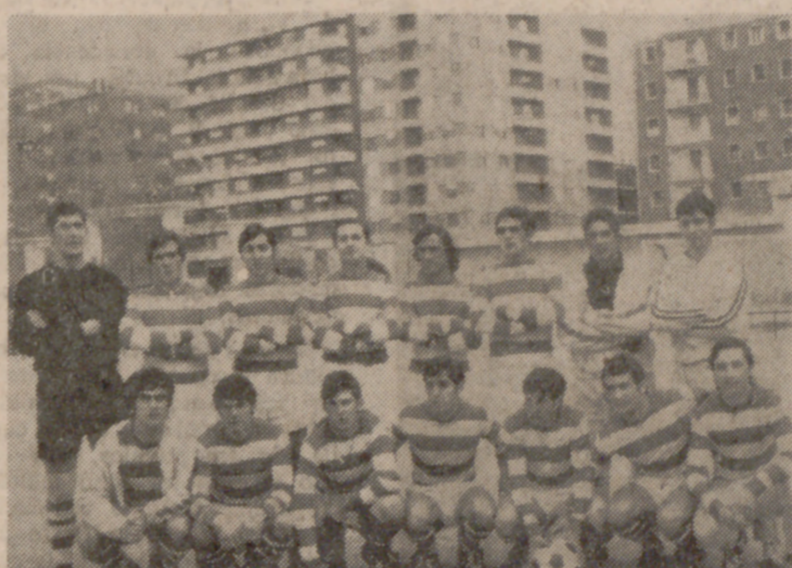
La Gimnástica Medinense está cubriendo una espléndida campaña, imbatida al frente de su grupo. Con esta formación ganó el sábado al Real Valladolid.

Choque importante y aguardado con extraordinaria expectación el que libraron el sábado, en el campo de la Federación, el R. Valladolid y la Gimnástica Medinense, ya que ambos equipos optaban al primer lugar del grupo, especialmente los medinenses, que están cubriendo una campaña espléndida.