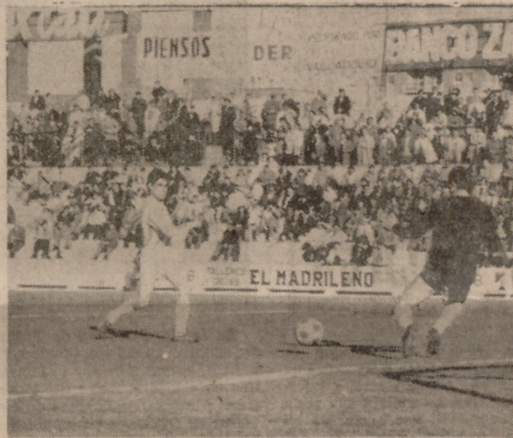
Nice, autor de los dos goles del primer tiempo, en la ejecución de uno de ellos.

La misma tónica se mantuvo en el segundo tiempo, aumentando el nerviosismo de los fasistas a medida que pasaba el tiempo y su dominio no fructificaba. Ya se es-