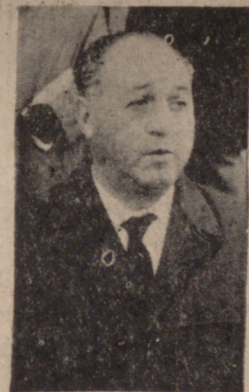
Había alegría en la caseta local, aunque no euforia, porque, sin duda, esperaba un triunfo más convincente.