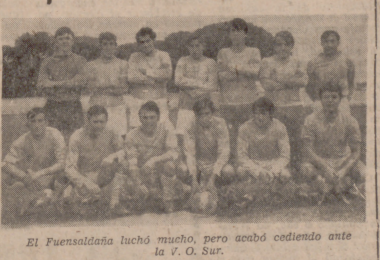
El Fuensaldaña luchó mucho, pero acabó cediendo ante la V. O. Sur.

En el grupo tercero, el San Pedro Regalado está evidenciando desde el principio de la competición una incuestionable superioridad que le permite avanzar solo en el primer puesto de la tabla, sin haber perdido un solo punto en siete jornadas.