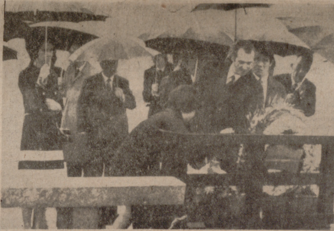
HIROSHIMA (Japón).—El Príncipe de España, don Juan Carlos, coloca una corona de flores ante el monumento erigido en memoria de las víctimas de la bomba atómica...