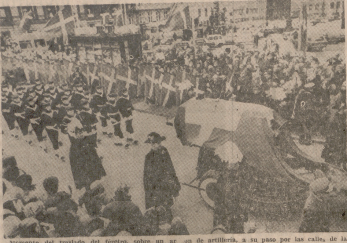
Momento del traslado del féretro, sobre un artillo de artillería, a su paso por las calles de la capital danesa.