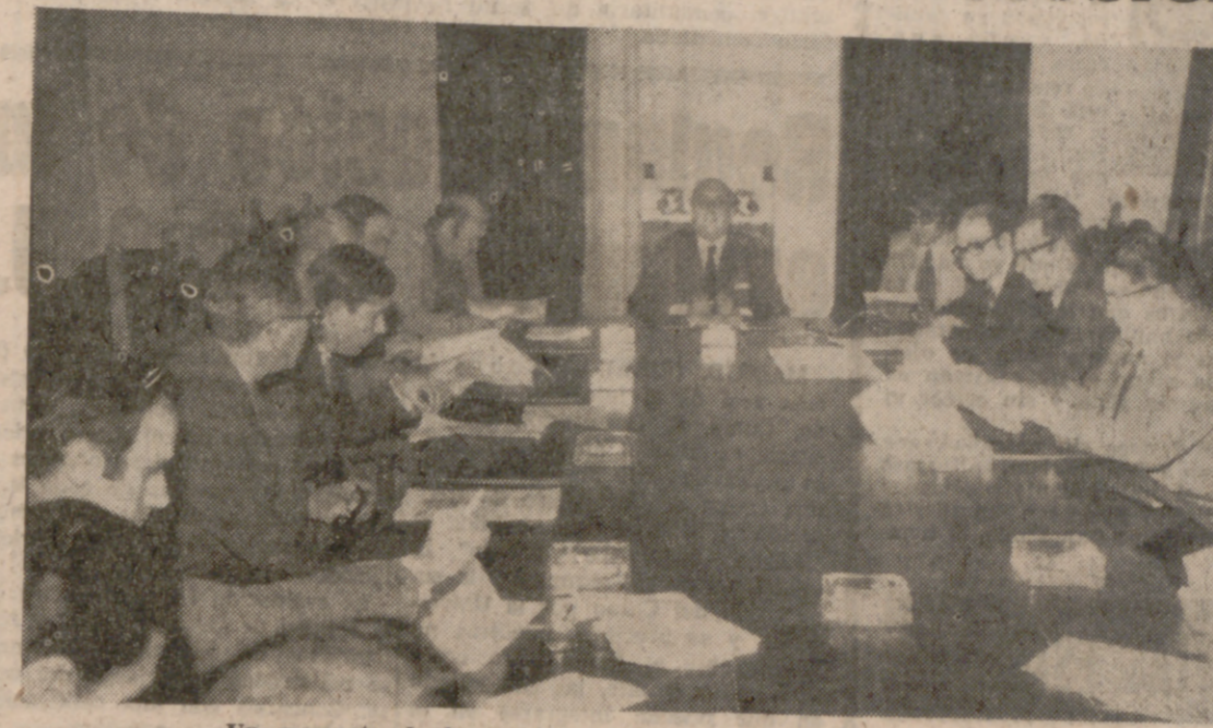
Un momento de la reunión celebrada ayer en el Ayuntamiento.

Cerró el acto el Alcalde, quien expresó su satisfacción por encontrarse en este acto después de dos años de ausencia. A todos los periodistas jubilados se les obsequió con un delicado recuerdo.