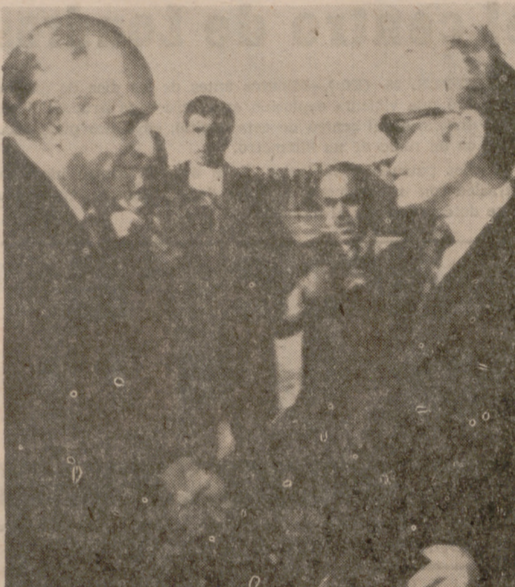
TEHERAN (Persia).—En visita oficial, ha llegado a la capital persa el Presidente de Pakistán, Ali Bhutto, donde fue recibido por el Sha, momento que recoge la fotografía.