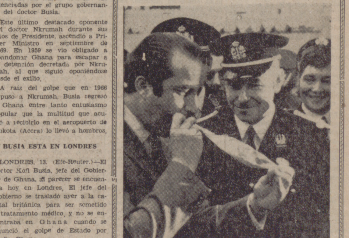
BRUSELAS.—El príncipe Alberto de Lieja, rodeado de policías, se somete voluntariamente a una prueba de conductores ebrios, a su llegada a la exposición de automóviles inaugurada en Bruselas.—(Telefoto Cifra Gráfica.)

TENSION CRECIENTE ¿Está «chispa» el príncipe Alberto?