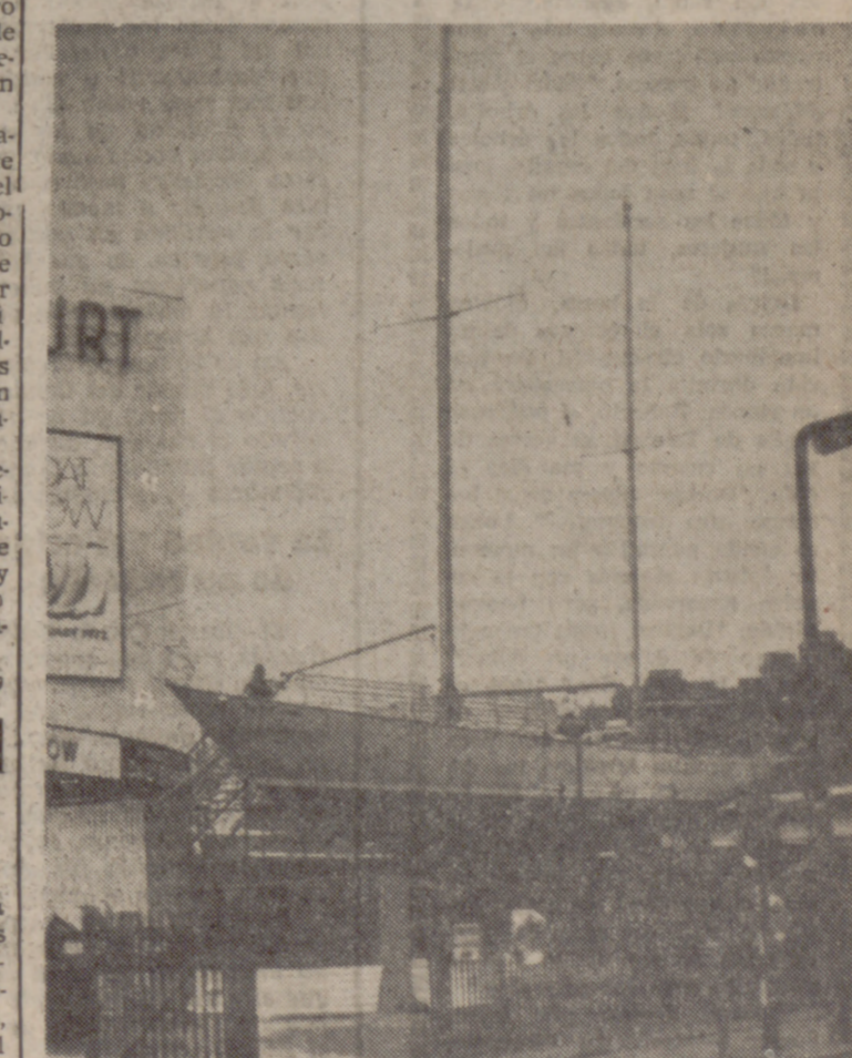
LONDRES.—"British Steel", el yate en el que Chay Blyth realizó el viaje alrededor del mundo desde Oriente a Occidente, es colocado en posición ante la sala de exposiciones de Darts Court para la Exposición Internacional de Embarcaciones que será inaugurada mañana.