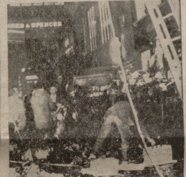
BELFAST.—Unas sesenta y dos personas han resultado heridas, algunas de ellas de gravedad, al explotar una bomba disimulada en un camión que transportaba botellas de cerveza...

Solución para la violencia: el Poder, para los mujeres El hombre es el ser más peligroso de la Tierra