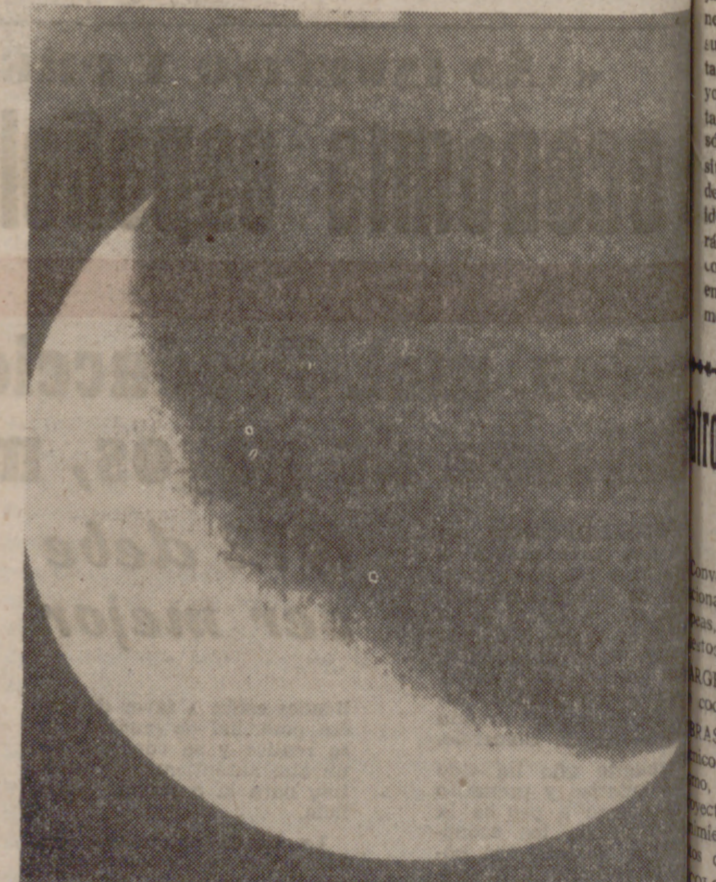
MOSCU.—Fotografía de Marte captada por la estación automática soviética "Marte-3", desde una distancia de 30.000 kilómetros.