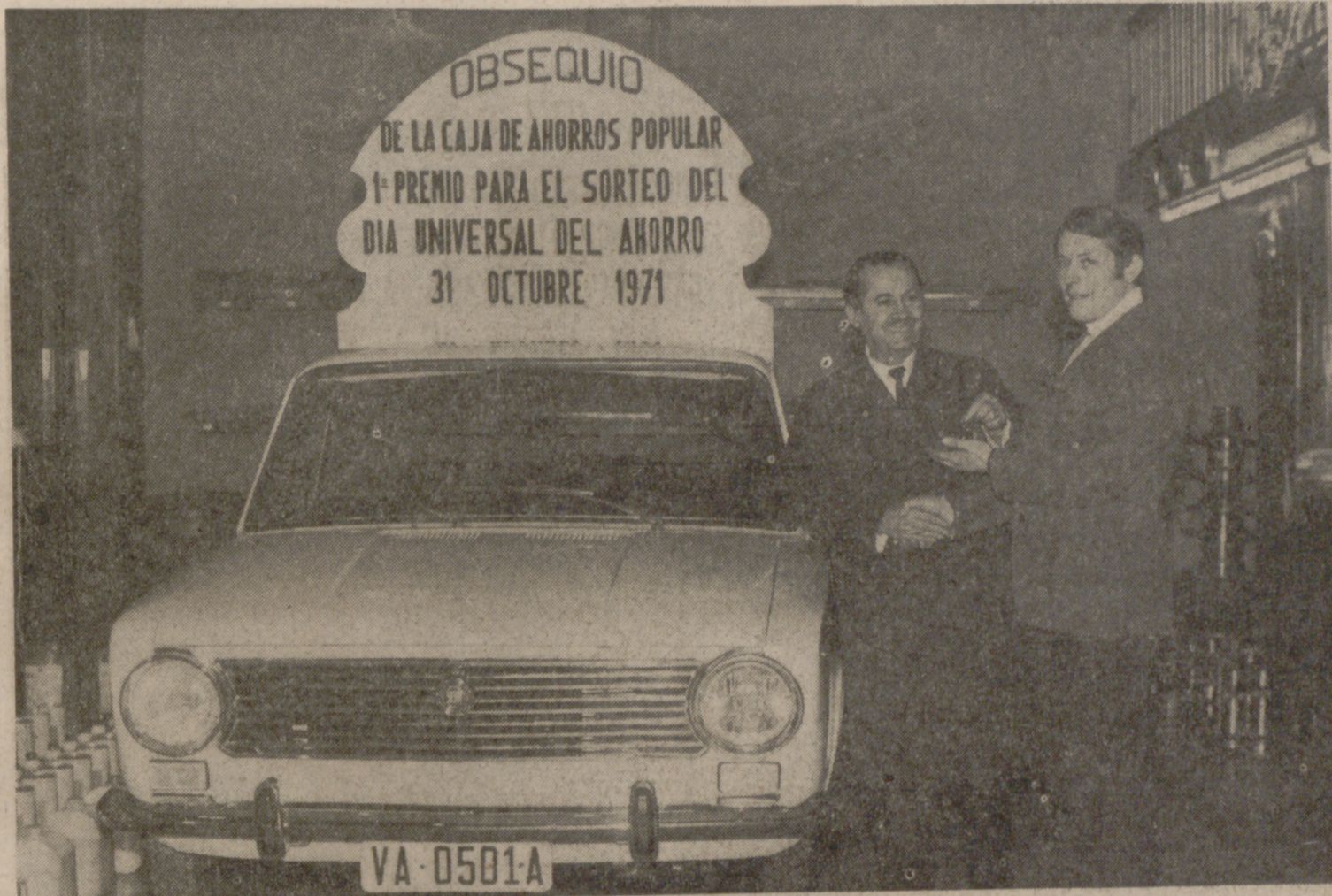
Un momento del acto de entrega del primer premio del sorteo extraordinario del "Día Universal del Ahorro", celebrado el pasado día 30 de octubre.