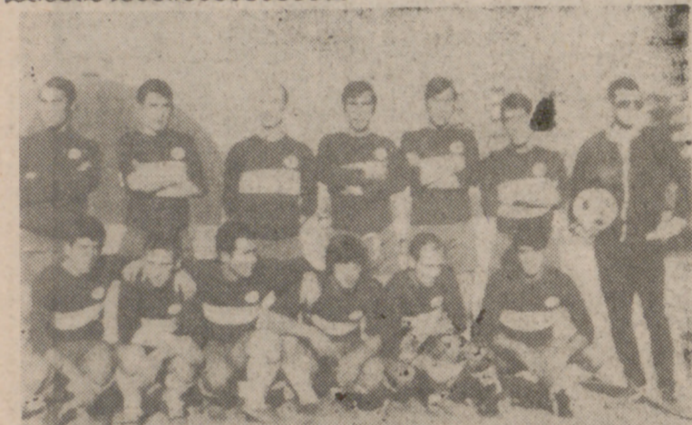
El Circular, en un partido emocionante y disputado, no tuvo suerte y perdió con el Arces.

MADRID, 8. (PRESA).—Hasta el momento, hay ya un máximo acertante de catorce resultados de la pasada quiniela, con sus siete variantes (tres equis y cuatro doses). Ha aparecido a primeras horas de la mañana de hoy y corresponde al sello número 5209.740, depositado en Valencia. Hasta el momento se ignoran más detalles. En el primer escrutinio, cerrado anoche, había veinticinco acertantes de trece y seiscientos ochenta y siete de doce.