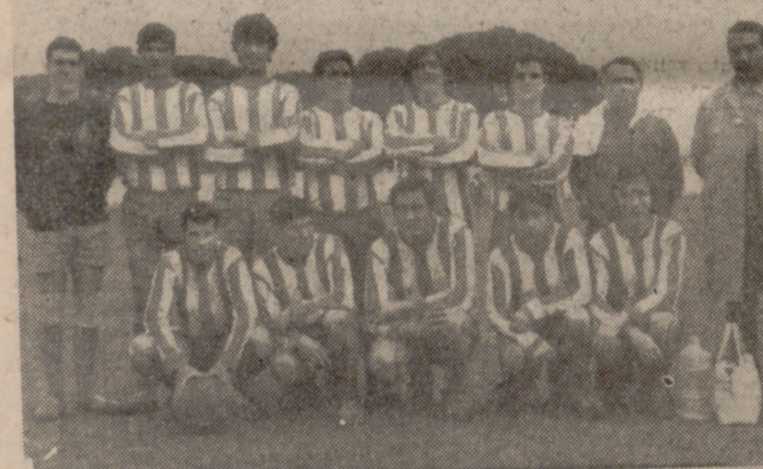
El sistema de penaltis proporcionó al San Pío X el paso a la siguiente eliminatoria.