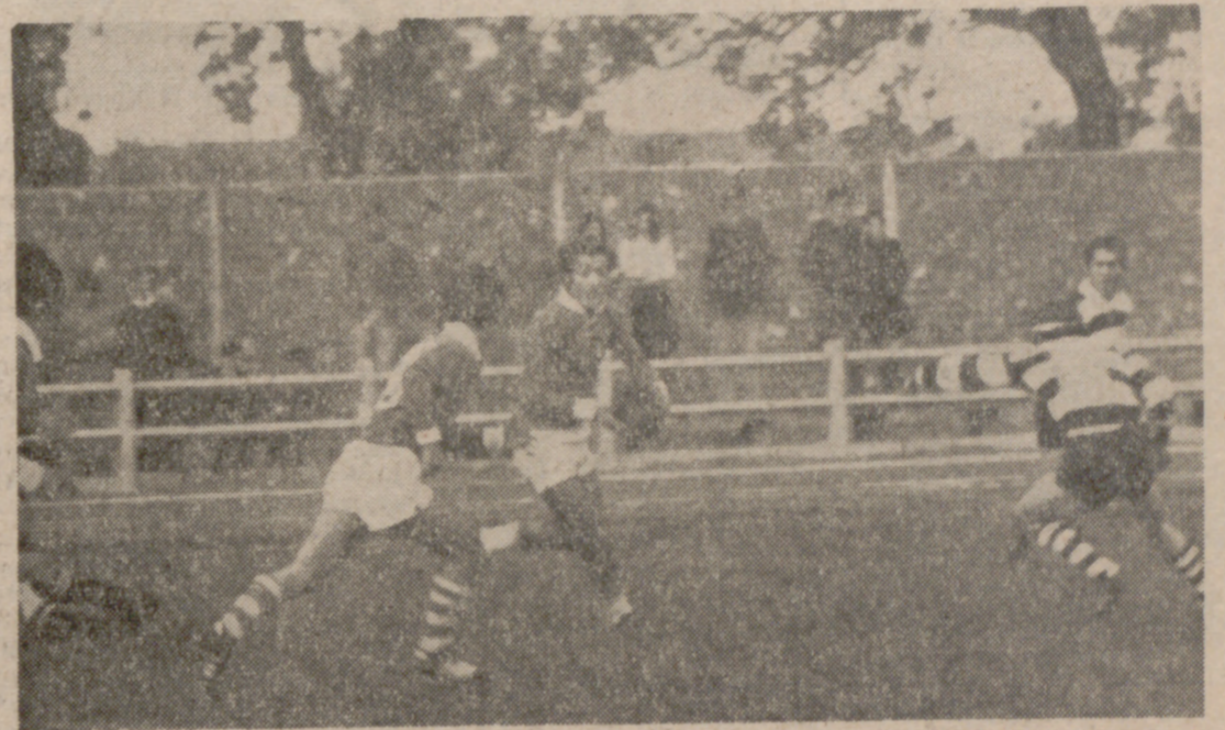
Un espectacular avance de las líneas tres cuartos catalanas, que los albinegros tratan de frenar.

El viento, principal enemigo, restó brillantez al juego