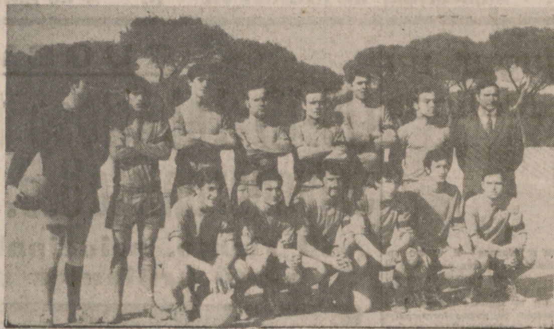
Aunque luchó mucho, no pudo el Vivero con la Ferroviaria.

G. Medinense, Arces, Ferroviaria y San Pío X también lograron su clasificación