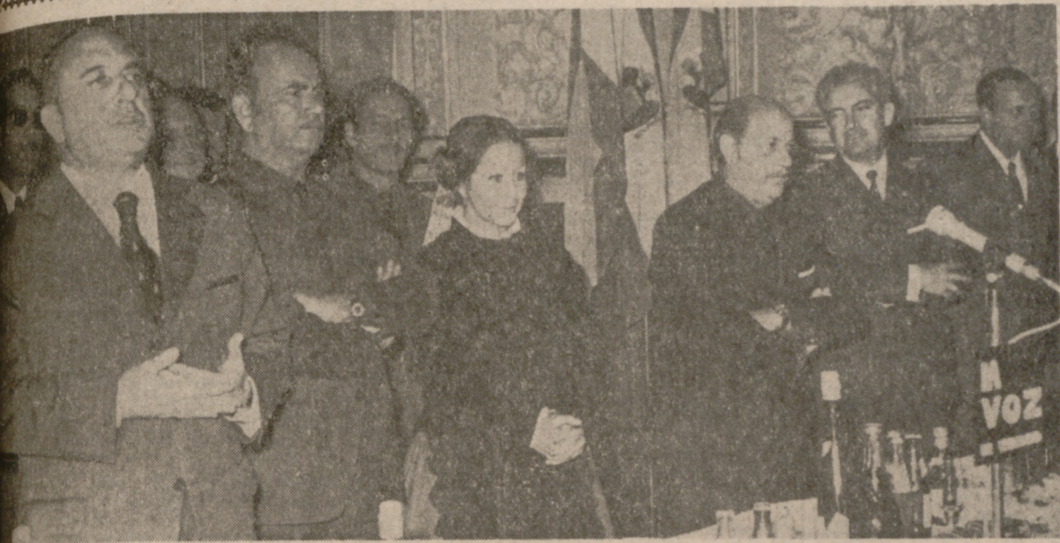
UN MOMENTO DE LA RECEPCION EN EL AYUNTAMIENTO

Con participación de más de trescientos ex combatientes pertenecientes a la Hermandad Nacional de la Primera Bandera de Castilla se celebraron ayer diversos actos conmemorativos del XXXV aniversario de la entrada en combate de aquella unidad falangista que el 4 de noviembre fundara Juan Antonio Girón.