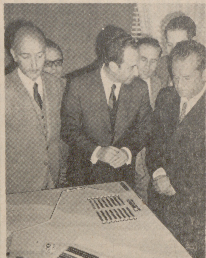
Un momento de la apertura de pliegos, durante la cual, varias personalidades contemplaron la maqueta del proyecto para dicha construcción.