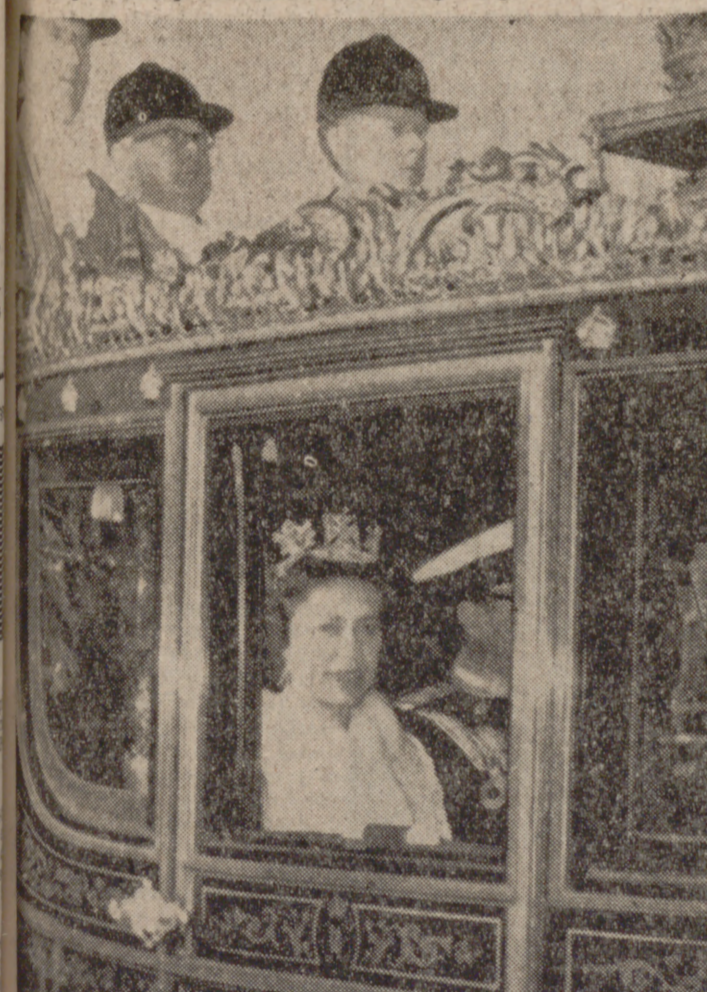
LONDRES.—La soberana británica, dirigiéndose en carruaje al edificio del Parlamento.—(Telefoto Cifra Gráfica.)

LONDRES. (Del corresponsal de PYRESA, MANUEL ADRIJO).—Rodeada de unas medidas de seguridad sin precedentes en esta capital, la reina Isabel II ha efectuado el recorrido desde Buckingham Palace a Westminster, donde inauguró ayer solemnemente el Parlamento para el año legislativo 1971-72. Unos 8.500 policías y detectives armados vigilaban estrechamente el trayecto y desde los tejados y balcones de las casas circundantes hasta que Su Majestad traspasó la puerta de entrada de la Cámara de los Lores. Con anterioridad a su llegada, el edificio del Parlamento había sido rodeado palmo a palmo en busca de alguna posible bomba.