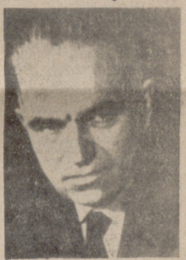
ESTOCOLMO.—El científico canadiense doctor Gerhard Herzberg, galardonado con el Premio Nobel de Química por "su contribución al conocimiento de la geometría de las moléculas, particularmente en lo que se refiere a los radicales libres".