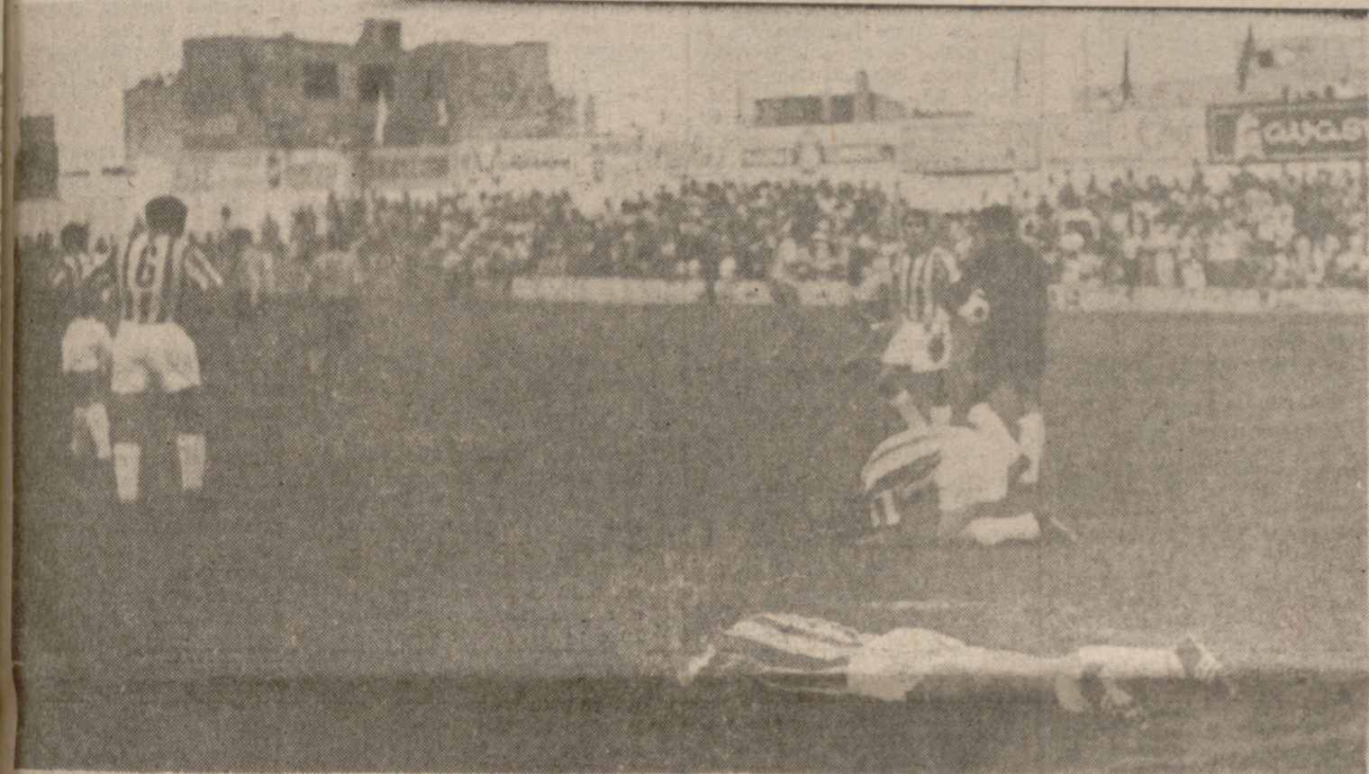
La estampa es todo un poema... Acaba de marcarse el gol de la victoria villarrealense y los jugadores blanquivioletas muestran bien claramente su desolación. Faltaban un s segundos y la cosa no era para menos...