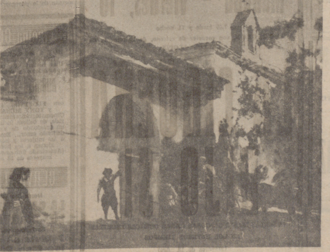
Estampa cervantina de Moreno Carbonero.