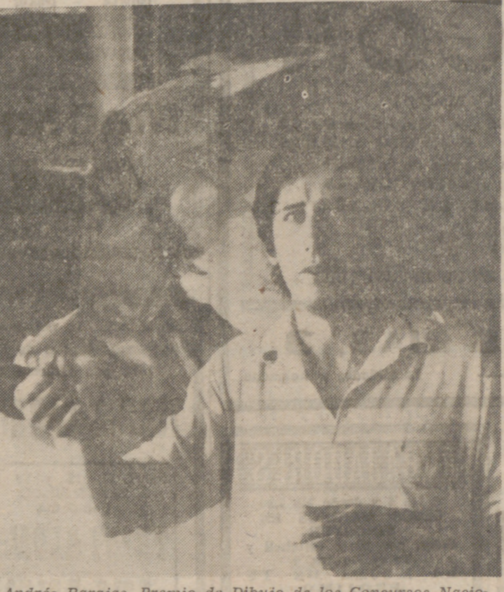
Andrés Barajas, Premio de Dibujo de los Concursos Nacionales de 1971, es una figura representativa de la joven pintura expresionista española.

Andrés Barajas ha conseguido dominar con seguridad el sentimiento de unos conceptos estéticos que caracterizan su obra por las posibilidades de movilidad. Incansable, mudando siempre, la obra de Barajas es un continuo error del miedo a la alegría, del dolor a la libertad. Tras su premio en los concursos nacionales de este año, su firma se ha revalorado. En otro orden de cosas, este éxito ha dado al artista una seguridad personal inestimable, una confianza en las propias posibilidades que, sin duda, tiene un valor real infinitamente superior al económico.