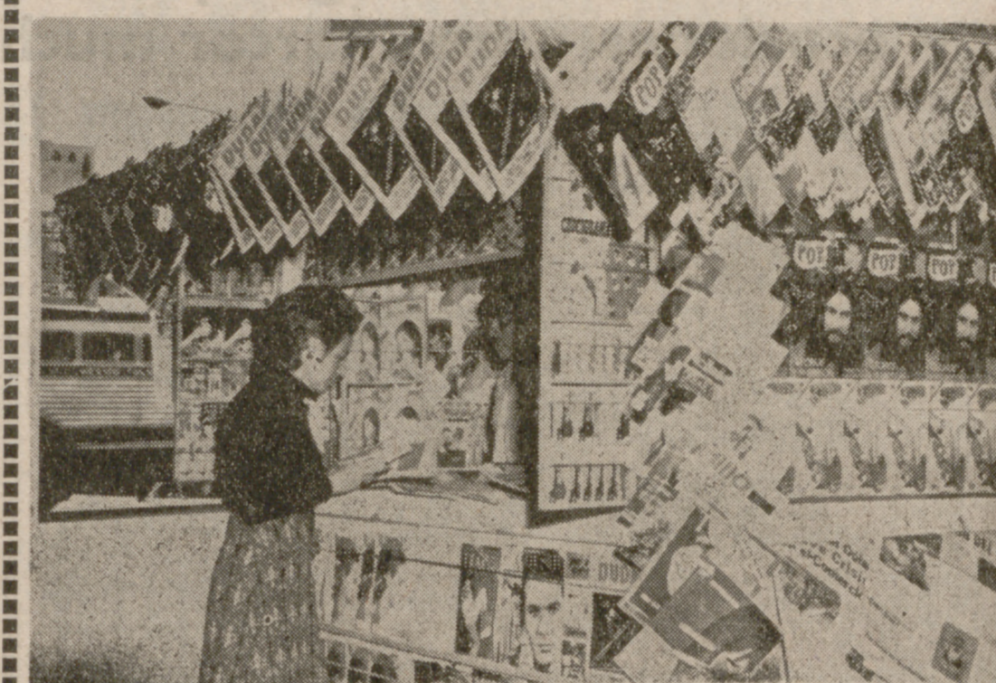
Los libros populares españoles tienen gran demanda.

La ciudad de México, con cerca de diez millones de habitantes y con la arteria urbana más larga de Hispanoamérica, la avenida Insurgentes, de casi cuarenta kilómetros de largo, es una ciudad donde es fácil perderse y donde resulta peli-groso dispersarse. Quiero decir, que se debe vivir por sectores y que desplazarse al centro, a las Lomas, o a la Zona Rosa, debe hacerse con tiempo y plan trazado, porque puede uno arriesgarse a llegar dos horas más tarde de lo previsto o a no llegar nunca.