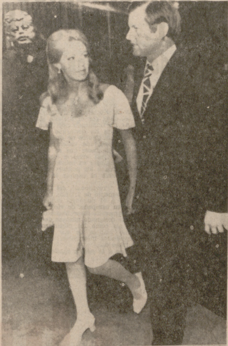
WASHINGTON.—El senador Edward Kennedy y su esposa Joan, atraviesan el vestíbulo del Centro "John F. Kennedy" para reunirse con los miembros del Congreso. A la izquierda se ve el gran busto del fallecido Presidente en una sala del Centro, que ha sido abierto oficialmente.