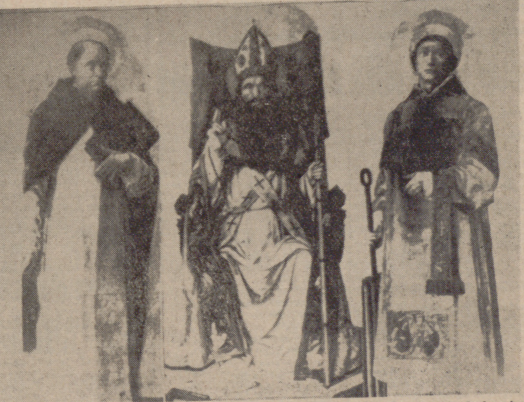
VENECIA (Italia).—Este tríptico de Bartolomeo Vivarini, del siglo XV, forma parte de los cinco paneles robados en la Basílica veneciana de San Juan y San Pablo. Las pinturas representan, de izquierda a derecha, a Santo Domingo, San Agustín y San Lorenzo.