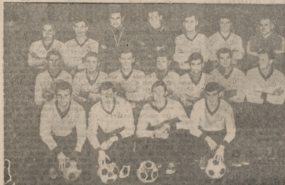
El Dinamo de Moscú, estuvo el pasado verano en España. Y en el "Trajeo Gampor" marcó cinco goles al Barcelona. Es un serio candidato a la conquista del trofeo "Villa de Bilbao".

Standard de Lieja, Vasas de Budapest, Dynamo de Moscú y Atlético de Bilbao tratarán de llevar el trofeo a sus vitrinas