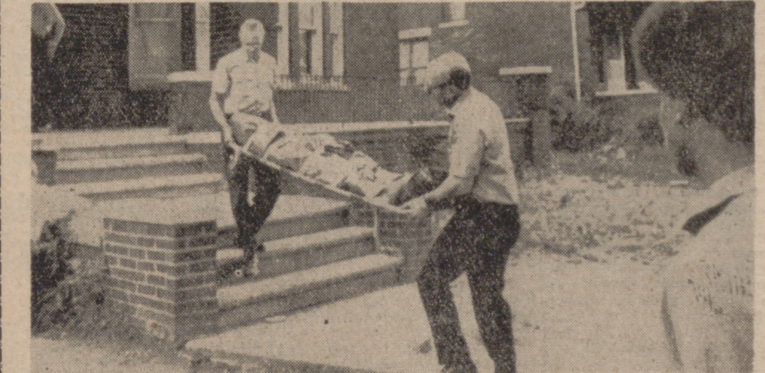
DETROIT.—Oficiales de Policía sacan uno de los siete cuerpos de una casa de la ciudad de Detroit. La Policía encontró los siete cuerpos muertos a tiros y un hombre herido en lo que se llama matanza "tipo ejecución". La Policía cree que las muertes están relacionadas con la "guerra de drogas" local.

Los cardiólogos discutieron durante el "symposium" cuáles pueden ser las dosis más oportunas, según la gravedad del caso tratado y el grado de disminución de la presión del paciente.