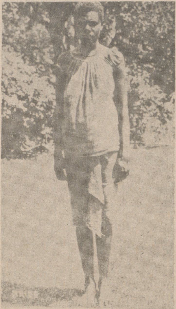
TIPO AUTOCTONO DE AUSTRALIA