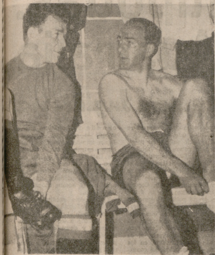
Kubala y Di Stefano, las dos figuras extranjeras que mayor éxito han conseguido en nuestro país. En la foto retrospectiva, ambos se preparan en el vestuario para defender los colores de la selección española.

Cada día, en estas alturas de la temporada en que los clubs tratan de reforzarse, tanto si su balance de la que termina ha sido bueno para mantenerlo o ha sido malo para corregirlo, se anuncia la llegada de jugadores de fuera de las fronteras. Muchos equipos españoles tienen jugadores "oriundos", tal y como les llaman en Italia o les llamaban cuando aquí los admitían. Los oriundos españoles son jugadores que por tener ascendencia española pueden reclamar la ciudadanía, en cuanto llegan a España o en su país de origen, casi exclusivamente hispanoamericano. En las naciones hispanoamericanas, naciones con problemas de demografía escasa, suele legislarse que todo nacido en el país adquiere la nacionalidad del mismo, si no reclama la de sus padres, según permite el país de origen. Por esta vía legal vienen a España con abundancia jugadores de Hispanoamérica. Ahora bien, han de demostrar que no son ni han sido internacionales en el país americano de su residencia. Allí pueden serlo, porque ya se ha dicho que por su nacimiento ya adquieren nacionalidad, y esta especie de refrendo futbolístico de ella les hace inhábiles para jugar en España, porque no podrían ser jamás miembros de