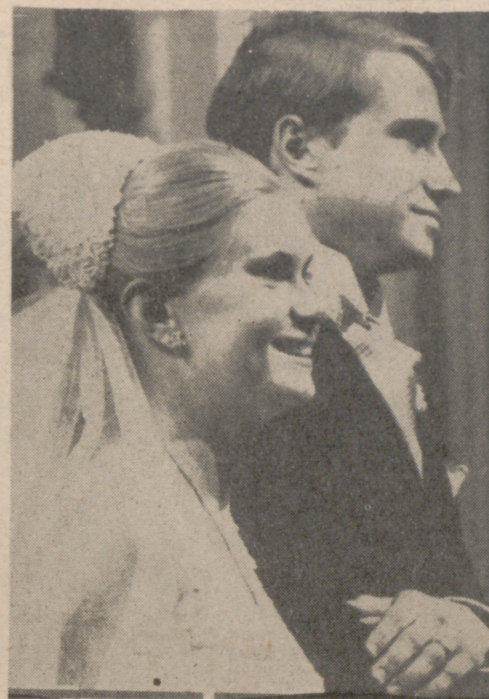
WASHINGTON.—En una ceremonia celebrada el sábado en la Casa Blanca, contrajeron matrimonio Tricia Nixon, hija del Presidente norteamericano, y Edward Cox. En la foto, los contrayentes momentos después de la ceremonia.