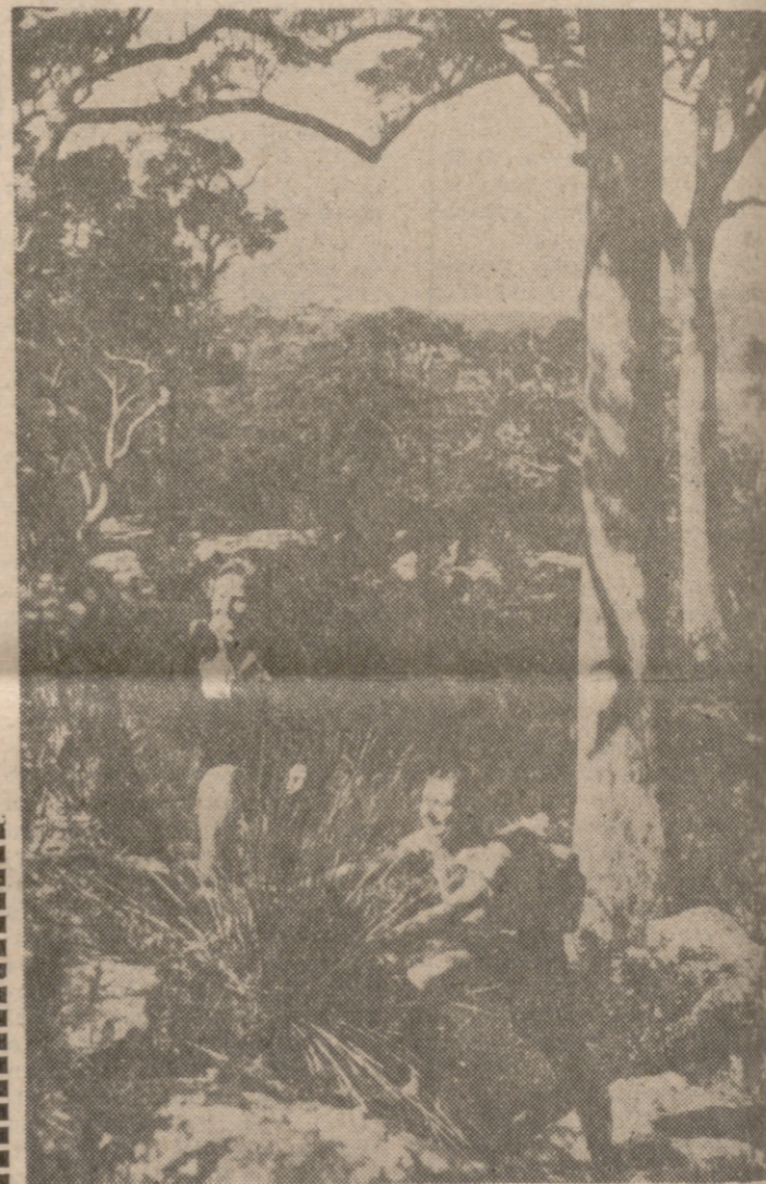
Australia es la primera potencia blanca del hemisferio austral en la costa del Pacífico. En total, once millones de blancos rodeados por grandes masas de color.

Biç. Estos "hippies" que deambulan por King Cross; es la burguesía sólidamente establecida en sus estructuras comerciales e industriales, que acude desde hace dos años a aplaudir "Hair", ¿qué significado alcanzan en esta encrucijada última del hombre blanco en el hemisferio austral? Cuando las gentes aplauden los terribles denuestos de los personajes jóvenes de la obra contra la bandera de los Estados Unidos —simbolizando unas estructuras que se desean ver neorielitadas—, ¿qué sentido especial tienen "aquí" y "ahora"? Este es el punto a que quería llegar en mi meditación itinerante. En este momento, uno