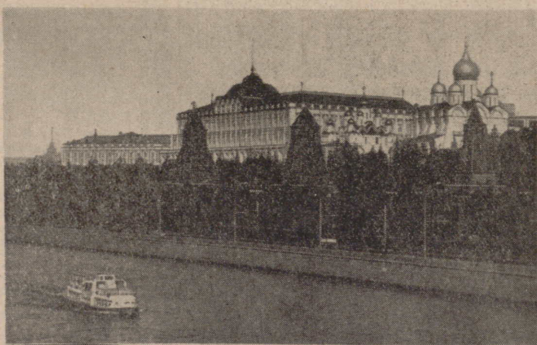
Vista del Kremlin desde la ribera del río.

— I — "¿Has estado en Moscú? Cuenta". Esta es la pregunta que durante todos estos días nos hacen amigos y conocidos. Es como si viniéramos de otro mundo, como si hubiéramos descubierto algo nuevo. Hay ganas, hay grandes deseos de conocer en directo las cosas de Rusia. Pocos preguntan por el partido de fútbol. Y es que, por esa curiosidad general de los españoles, es por lo que la selección nacional de fútbol ha contado en esta singular ocasión con tantos seguidores. No ha sido el fútbol para la mayoría de esos cinco mil españoles que fueron a Moscú el objetivo del viaje. Sabo los jugadores, algunos directivos y los periodistas especializados en deportes, para el resto el partido de fútbol entre los equipos de Rusia y España ha sido el pretexto. Muchas de las personas que en los distintos aviones y por distintos medios se concentraron en Moscú en los días del partido no eran en realidad aficionados al fútbol. Otros sí lo eran, sí lo son, pero no hubieran ido si el partido se juega en otro lugar, en otro país. A la gran mayoría, la selección nacional les importaba poco. Esa es la verdad.