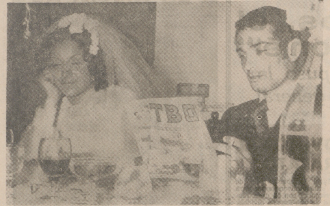
TUDELA (Navarra).—No se trata de ninguna pareja cansada de vivir y cansada de largas convivencias. La escena ha sido captada por el fotógrafo en la sobremesa del buñete pupial de una pareja de novios tudelanos. La novia, que no quería discutir en este su primer día de casada; después de mirar a su recién estrenado marido, pensó: Si él puede leer un "TEO" en este momento, bien puede yo echar una siestecita después del ajeteo de la mañana. Y dicho y hecho. El, abstraído

con su lectura, y ella, soñando no sabemos en qué. El fotógrafo, que nunca falta en las bodas, dudó un momento en sacar la foto, pero pensando en la originalidad y no en la comercialidad, puesto que pensamos que los contrayentes no querrán comprarla, tiró del disparador y de esta manera no se puede adivinar que esta escena existió, porque si no viéramos, no lo creeríamos.