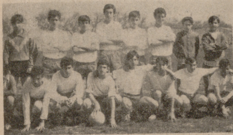
Uno de los conjuntos finalistas en la competición de fútbol.

Nutrida participación y organización perfecta de la Delegación Provincial de la Juventud