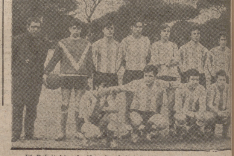
El Beloit hizo la "hombreada" y frenó al San Pío X, restándole muchas posibilidades.

Por 2-1 ganó el Santovenia, aunque oportunidades hubo para que se dieran otros resultados.