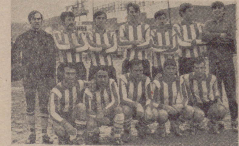
El Atlético Fasa sólo pudo empatar con el San Carlos y su tropiezo puede ser muy serio.

Página de JOSE MIGUEL ORTEGA