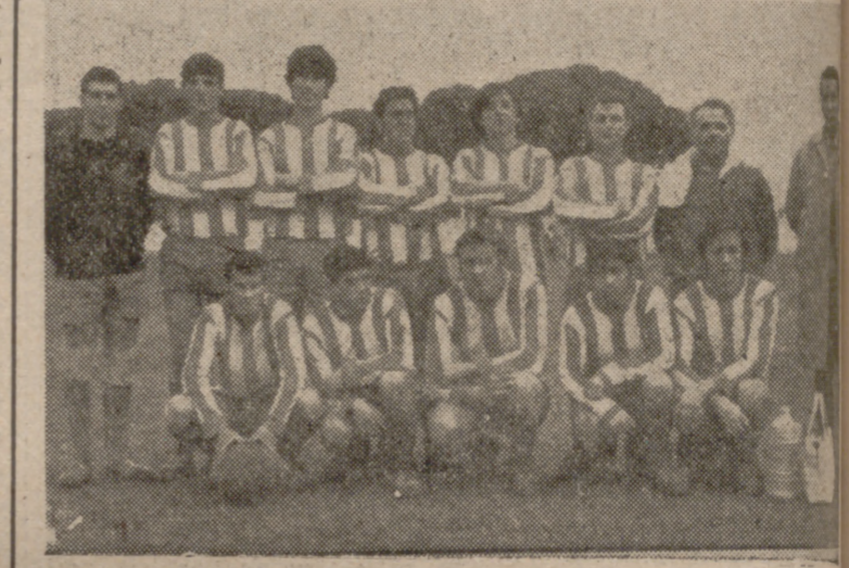
Formación del San Pío X, que ayer tropezó ante el modesto Beloit.

Por último, y con bastante dificultad, el Santovenia logró imponerse a La Flecha. Como se ve, a la vista de la clasificación de ambos equipos, hubo equilibrio