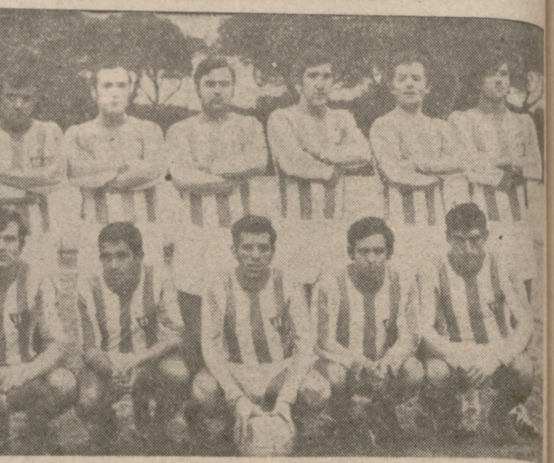
El Atlético Valladolid, que mantiene una dura pugna con el Circular para lograr el título en Segunda Regional.

En el equipo reina una gran camaradería y la deportividad con que sus hombres se comportan constituye una de las virtudes más sobresalientes de este entusiasta conjunto que es la Juventud Josefina.