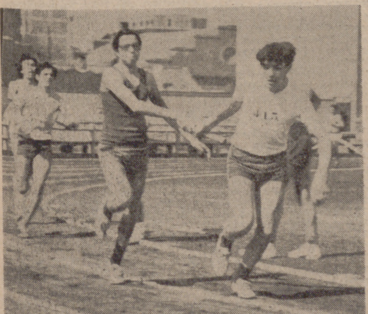
Final juvenil de relevos 4 x 100 de la jornada de ayer.