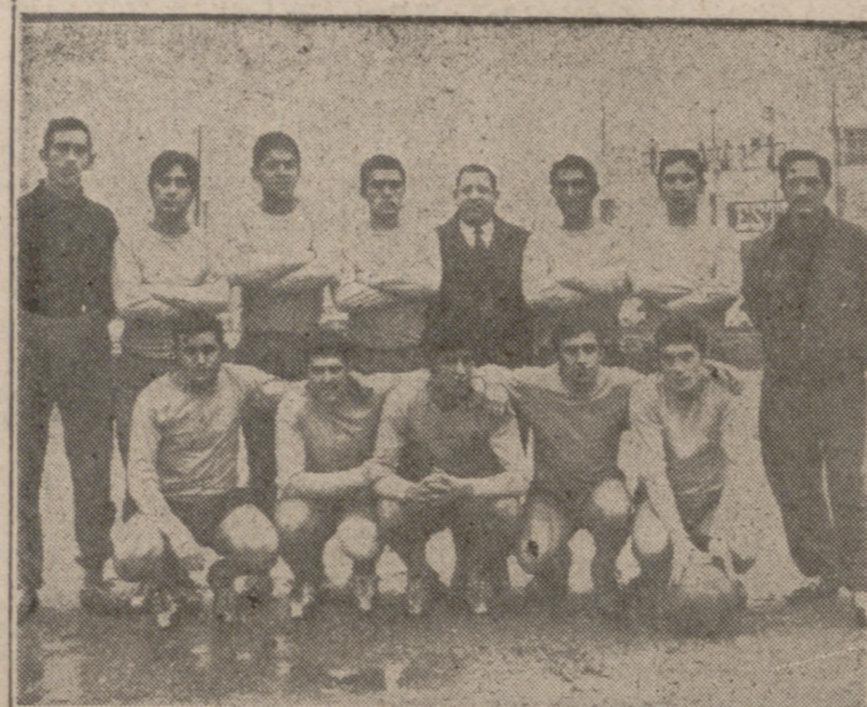
El equipo más realizador de la jornada fue el Iscar, verdaderamente irresistible frente a la Gimnástica Medinense.

Siguió el San Carlos buscando afanosamente el triunfo y cierta-