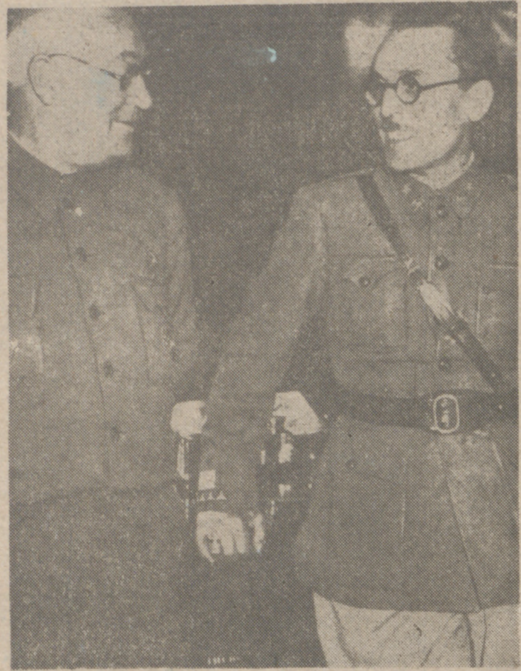
El general Miaja, "defensor de Madrid", con el coronel Casado, cuando era jefe del Estado Mayor del Ejército del Centro.