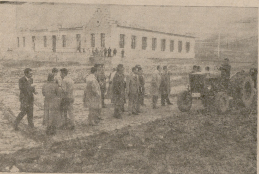
EN MOTA DEL MARQUES

Las bases íntegras del concurso pueden solicitarse, por escrito o personalmente, en la Comisaría General de Abastecimientos y Transportes, Almagro, 33, séptimo. Madrid, 4.