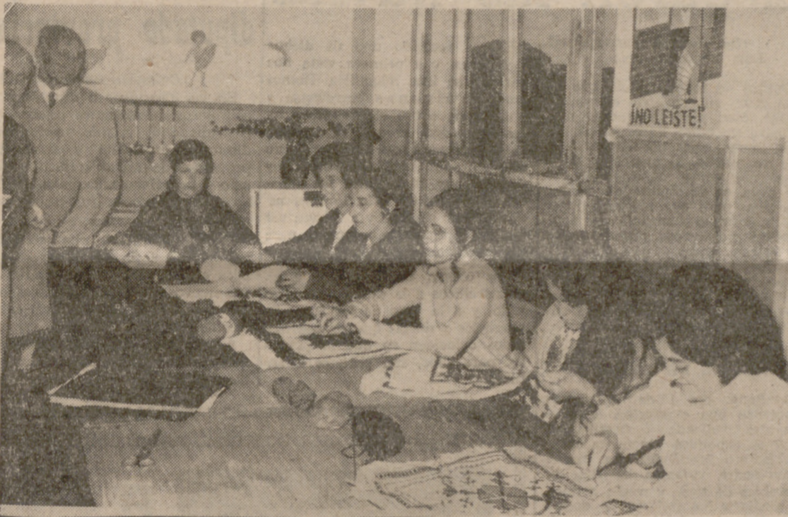
EN VEGA DE VALDETRONCO