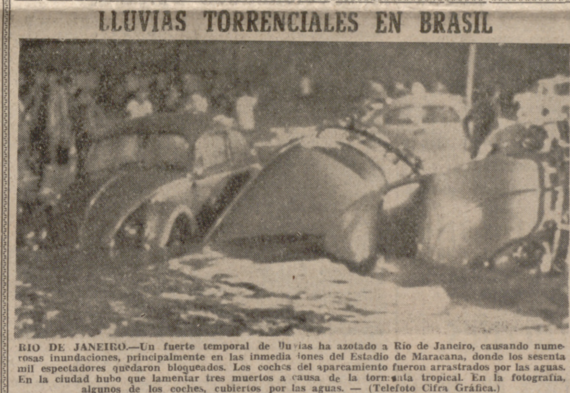
RIO DE JANEIRO.—Un fuerte temporal de lluvias ha azotado a Rio de Janeiro, causando numerosas inundaciones, principalmente en las inmediaciones del Estadio de Maracana, donde los sesenta mil espectadores quedaron bloqueados. Los coches del aparcamiento fueron arrastrados por las aguas. En la ciudad hubo que lamentar tres muertos a causa de la tormenta tropical. En la fotografía, algunos de los coches, cubiertos por las aguas.

En un discurso de tres minutos, después de que su abogado y antes de que el Jurado se retirase a deliberar sobre la pena que debería ser impuesta, Calley dijo: "Mi única falta fue la de proteger las vidas de mis soldados."