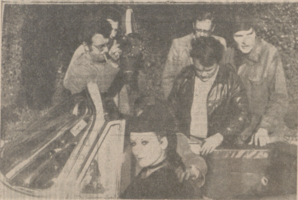
CASTRO URDIALES. — Marisa Medina, la popular locutora-presentadora de Televisión Española, fotografiada en un descanso del rodaje de la película en la que interviene, titulada "Si fulano fuera meengano". Participan en ella Antonio Ozores, José Luis López Vázquez, Florinda Chico, Gracita Morales y otros actores.