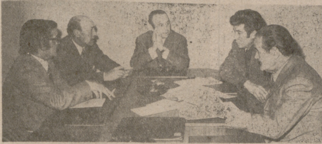
base de los recursos de las Mutualidades, de forma que no quede desvirtuado su verdadero fin. El dinero de los trabajadores debe de ser para los trabajadores. No cabe duda que este Congreso Nacional será decisivo. Su celebración, al cabo de un cuarto de siglo desde la creación de las Mutualidades satisface a todos, porque todos lo esperábamos.

Una ponencia particularmente interesante: «Criterios para una reforma del sistema de pensiones»