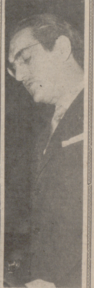
MADRID.—Durante la sesión plenaria de las Cortes Españolas ha sido presentado el proyecto de Ley Sindical. En la foto, el ministro delegado de Sindicatos, señor García-Ramal, durante la presentación de dicho proyecto de Ley.