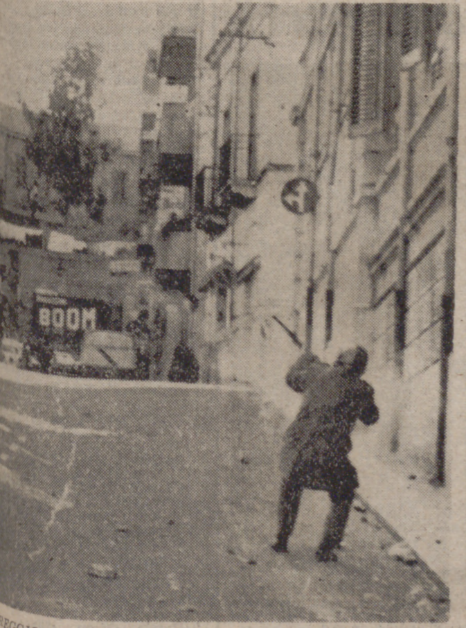
REGGIO CALABRIA.—Un policía, en una calle de esta ciudad, lanza con su arma una granada de gases lacrimógenos contra una ventana donde un grupo de manifestantes le arrojan piedras. Varios policías y numerosos manifestantes resultaron heridos a causa de los disturbios.

Fotografía con claridad un periódico a trece kilómetros NUEVA YORK. (PYRESA).—Los Estados Unidos siguen investigando en el campo de la fotografía aérea usando los satélites-espías como portadores de cámaras de alta precisión que han sustituido con ventaja a las que portaban los aviones espías "U-2" y "SR-71". En la actualidad, varios de estos satélites-espías, que en su trayecto orbital cubren vastas regiones de la Unión Soviética, van equipados con cámaras capaces de fotografiar un periódico desde 13 kilómetros de altura, con tal nitidez que se pueden leer los titulares.