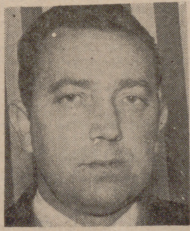
—¿Qué valor das a este triunfo? —Es importante porque yo, personalmente, he estado a punto de irme de fútbol...