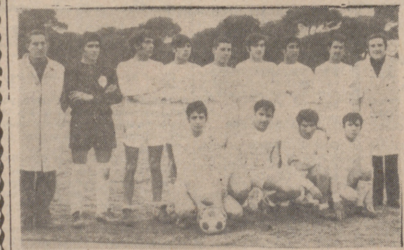
Formación de La Flecha, que no pudo batir al Rácing Valladolid en un partido muy emocionante y disputado por lo incierto del marcador. De cualquier forma, su capacidad de lucha y entusiasmo satisfizo plenamente a los espectadores.