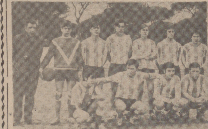
El Beloit, luchando de principio a fin, se hizo acreedor a una importante aunque apretada victoria sobre el Santovenia. Su triunfo fue una de las numerosas sorpresas que deparó la jornada...