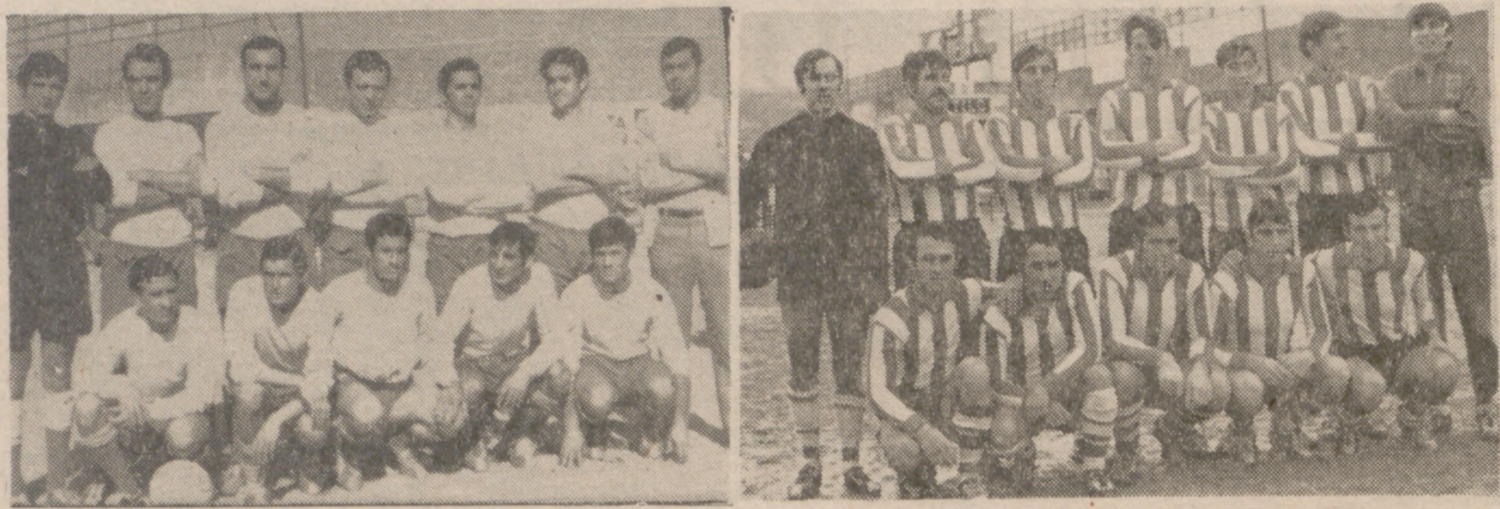
Esos son los protagonistas de la final del Campeonato de Aficionados, disputada ayer en el Estadio. Grupo de Empresa Fasa-Renault y Atlético Fasa libraron un choque emocionante en el que acabó por imponerse la mayor fortaleza y experiencia de los primeros, que representarán a Valladolid en el Campeonato de España. Lo más sobresaliente, sin embargo, es el éxito de la Sección de Fútbol de la factoría automovilista al colocar a dos de sus equipos en la gran final. Es algo de lo que nadie ha podido presumir hasta ahora...