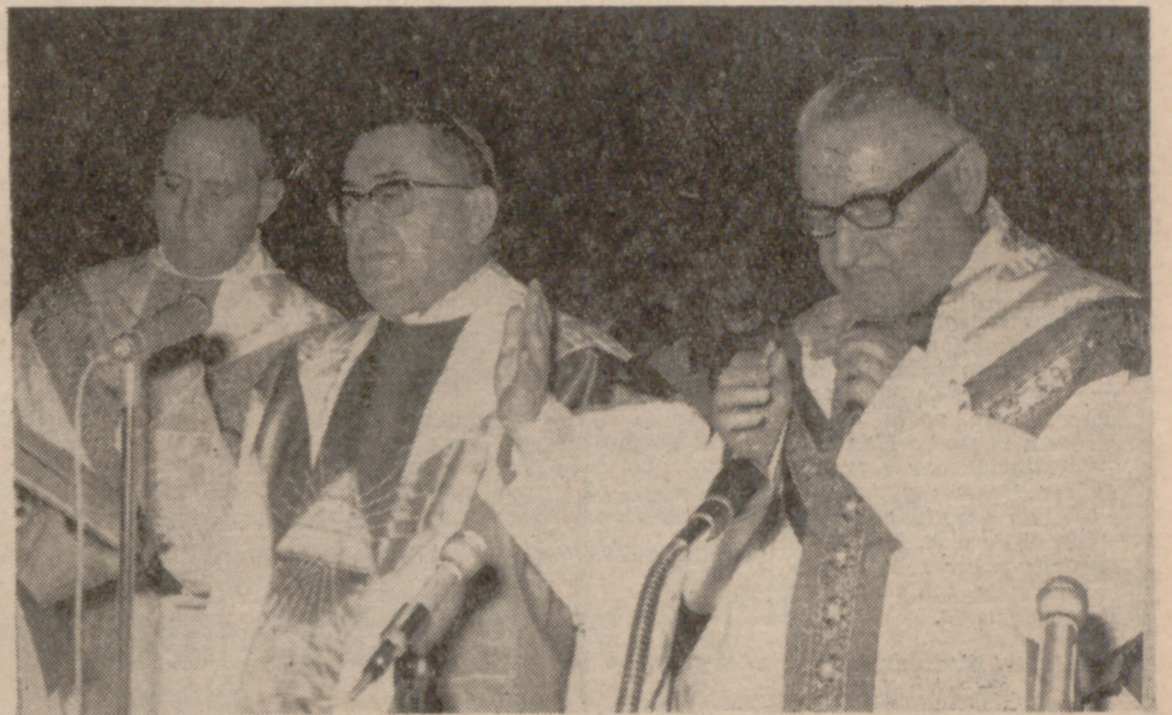
Un momento de la misa concelebrada por el nuevo Prelado.