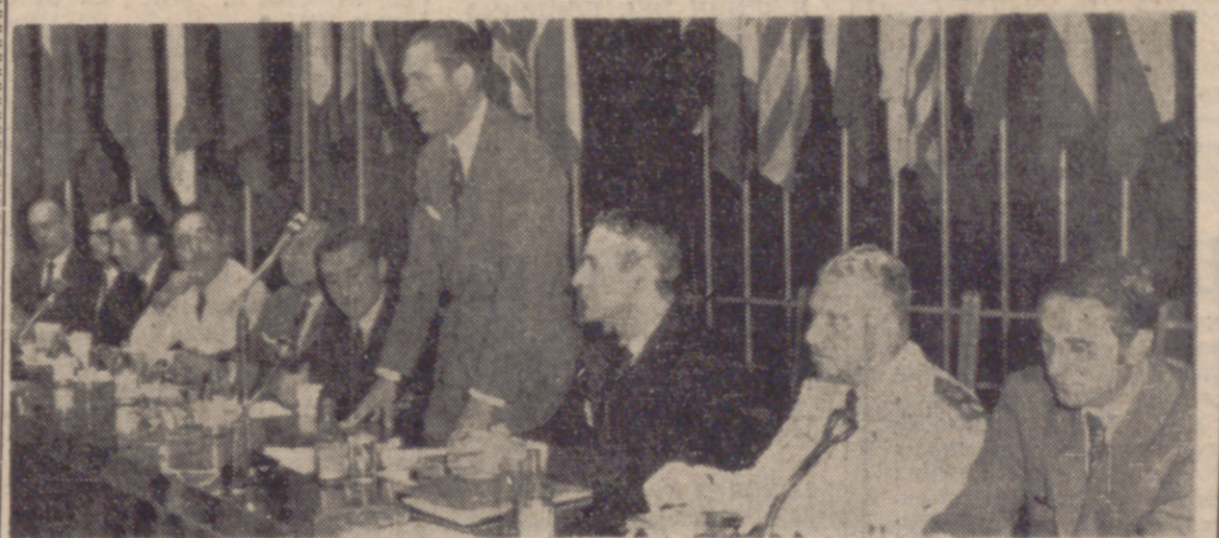
BARCELONA.—El ministro de Comercio, señor Fontana Codina, durante su discurso en el acto inaugural celebrado en el Palacio de las Naciones del XXIII Congreso Europeo de Marketing y Opinión "ESOMAR". Al que asisten más de un millar de especialistas en "Marketing".