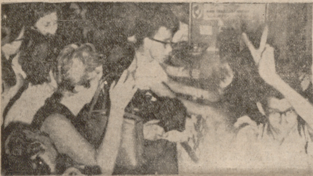
AMMAN. — Pasajeros del avión de la Compañía Swissair, "DC-8", que fue secuestrado a la salida de Zurich el día 6, reunidos en el Hotel Intercontinental de Amman. Fuentes guerrilleras de Beirut informan que se ha reanudado el fuego. Se informa que fuego de mortero está siendo recibido en los alrededores del Hotel Intercontinental.