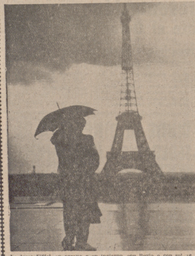
La torre Eiffel, en verano o en invierno, con lluvia o con sol, se ha convertido en la imagen más representativa de la capital de Francia.

"La torre Eiffel, pese a sus ochenta y un años, se encuentra en perfecto estado y tiene vida para muchos años, lo menos un siglo. La torre Eiffel tiene una salud de hierro." Con estas palabras, la sociedad que administra el monumento más visitado de toda Francia, ha puesto fin a los rumores según los cuales "Mademoiselle du Champ de Mars" estaba llena de alifafes, comida por la oxidación y casi desahucada por los ingenieros. El chisme llevó a tomar tal carta de naturaleza, que hasta se le daban sólo cincuenta años de vida. La gran obra de monsieur Gustave tiene cuerda para rato. Por lo pronto se la someterá a una cura de fortalecimiento durante cinco años. Y después ya pueden caerle lluvias encima y azotarla huracanes, que se mantendrá más derecha y más pimpante que nunca. Este tratamiento costará treinta y dos millones de francos, pero vale la pena sacárselos del bolsillo en honor de la atalaya parisense, símbolo de los más supremos donaires, etcétera.