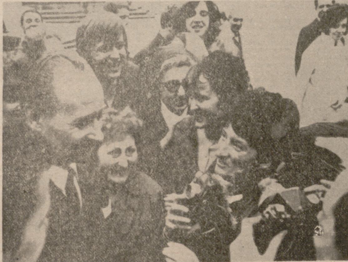
Dubček... acababa de ser elegido presidente de la Asamblea General. Todos sonreían en Praga.

Alexander Dubček saltaba por primera vez al conocimiento de la opinión pública internacional, convirtiéndose, a los 46 años, en el jefe más joven de los partidos comunistas de Europa Oriental. Obrero de la fábrica Skoda (la Krup de Alemania o la Fiat italiana), permaneció durante los años del protectorado alemán y durante la Guerra Mundial en la URSS, donde se educó en el credo comunista. Durante la efmera "Primavera de Praga" su nombre sería cantado por las calles y plazas de Praga y de Checoslovaquia como símbolo de independencia y de libertad. El acceso de Alexander