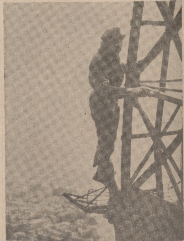
La torre Eiffel se remozo con la llegada de la primavera. Este obrero le hace la "toilette" sin importarle mucho la altura.

Y como no hay dos sin tres, vale decir que con el dinero de las entradas se podrían haber comprado sesenta y cinco espías.