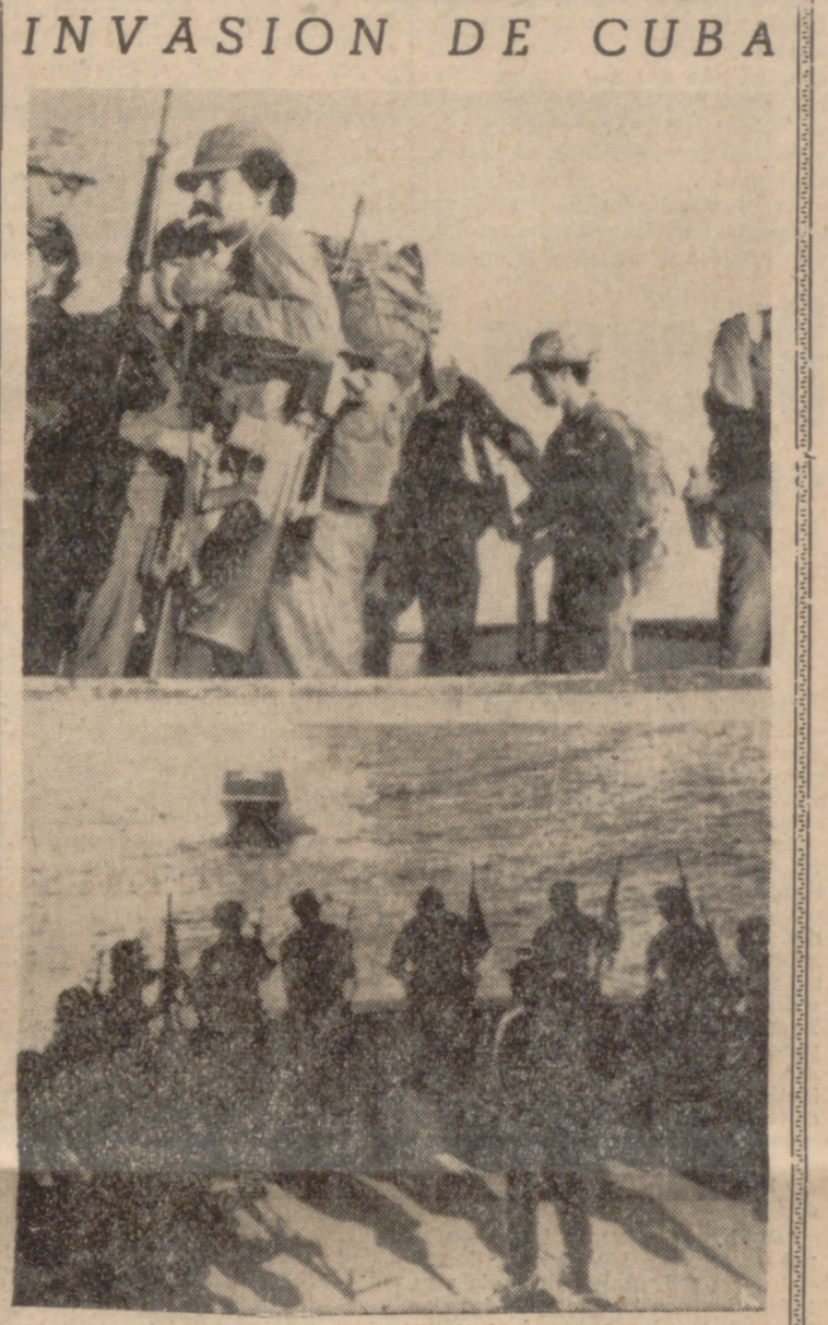
INVASION DE CUBA

Esta conferencia de alto nivel ha sido la primera en la que el príncipe Sihanuk ha debido salir de Pekín, donde ha estado viviendo desde el 19 de marzo, el día después de ser destituido.