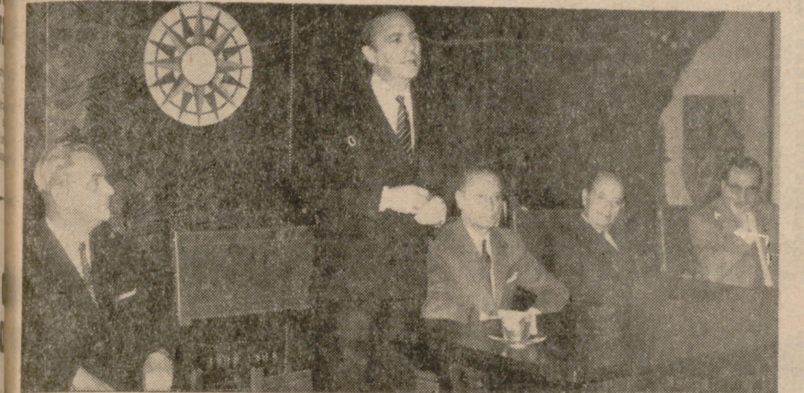
Don Gregorio Marañón, en la clausura de la Exposición de Culturas Incaicas en la Casa-Museo de Colón.