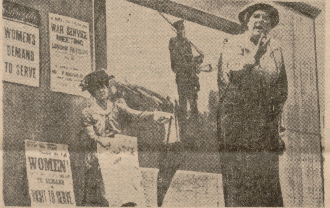
Una imagen de los tiempos heroicos del feminismo. La señora Drummond, una de las líderes del movimiento británico, habla en un comicio en las calles de Londres.