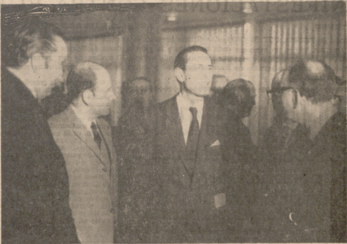
BOGOTA.—El ministro de Comercio español, don Enrique Fontana Codina, de visita oficial a Colombia, al final de la cual firmara el nuevo convenio de intercambio comercial entre los dos países, fue recibido a su llegada a esta capital por el embajador español, don Joaquín Juste, y el ministro de Desarrollo colombiano, don Hernando Gómez Ojalora. En la fotografía, el Ministro español conversando con el de Desarrollo de Colombia, en presencia de altas personalidades del mundo político y comercial.