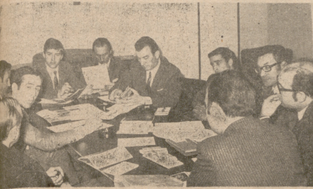
Un momento de la reunión celebrada esta mañana.

Estudia el emplazamiento de los equipos de transmisión