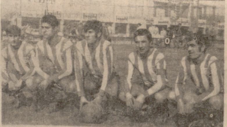
Vanguardia de la Gimnástica Medinense, que no encontró muchas ocasiones de lucirse ante la resolución de la zaga del Sava.

Las pretensiones de la Gimnástica Medinense no eran otras que las de mantener el cero a cero el final de los primeros cuarenta y cinco minutos, para después hacer valer su superioridad aprovechándose del lógico nerviosismo local, y a punto estuvo de conseguir su propósito, ya que hasta el minuto cuarenta no consiguió el Sava inaugurar el marcador.