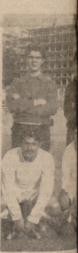
Bloque defensivo del Estrella Azul inspirado en su lucha por la lanterna del Atlético.

La jornada, en general, estuvo presidida por los resultados cortos y victorias comprometidas de los favoritos. Ante el colista, el Juventud Fasa tuvo también sus problemas y hubo de conformarse con un 2-1, que refleja lo que hubo en el campo. Dominio más insistente por parte de los fanáticos y entusiasta defensiva del Juan de Austria, que llegó a ser peligroso en sus incursiones por el área rival. El Juventud Fasa pudo resolver el partido en el primer tiempo, pero al no hacerlo pasó por momentos de peligro y en ningún instante las tuvo todas consigo. La única victoria realmente clara fue la cobrada por el Ruano Va-