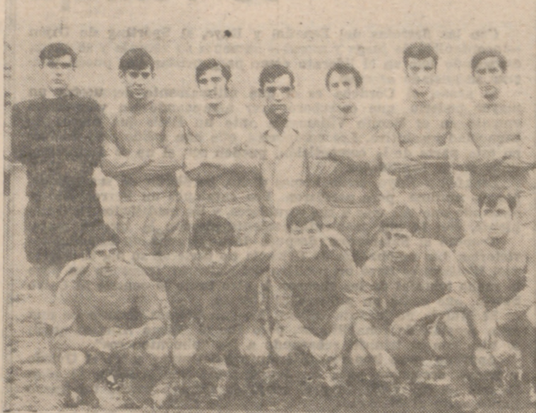
El Instituto Nacional de Colonización, que, pese a su condición de favorito, estuvo a punto de sufrir un disgusto ante el San Nicolás.

El líder pasó muchos apuros ante el San Nicolás