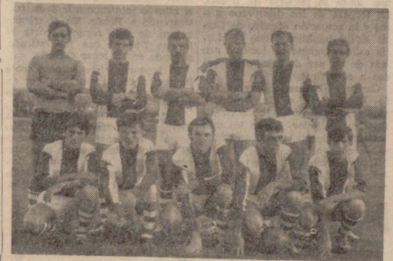
Formación del Club Deportivo Rioseco, que ayer ganó con comodidad y amplitud.