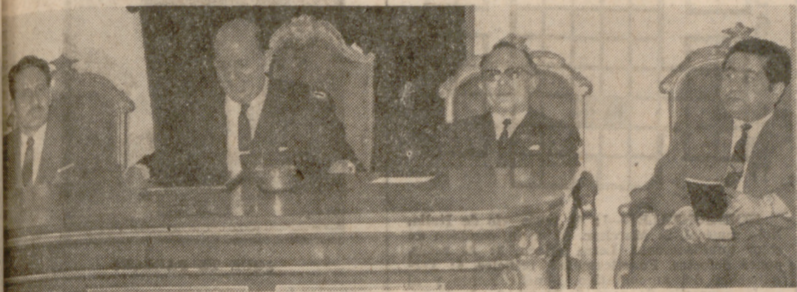
REUNION DEL CONSEJO LOCAL DEL MOVIMIENTO

Se reunió con la Corporación Municipal y el Consejo Local del Movimiento