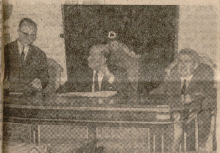
El Gobernador Civil, reunido con la Corporación municipal.

Después del almuerzo, a las cinco estrados, todos los delegados de servicios y otros consejeros.