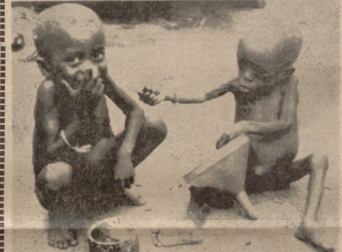
PORT HARCOURT (Nigeria).—Expresiva fotografía de unos niños de esta localidad de Nigeria, refugiados de Biafra y con evidentes muestras de desnutrición, fotografiados cuando en un centro de alimentación de esta localidad comían en una lata y en un embudo.