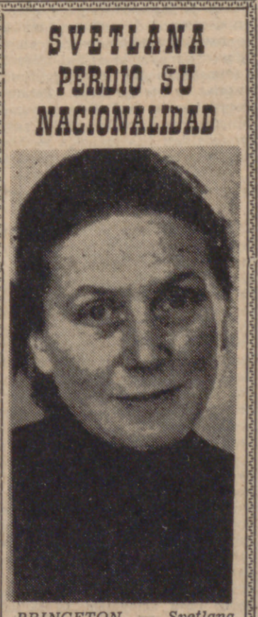
PRINCETON. — Svetlana Alliluyeva Stalin conversa con los periodistas en su residencia de Princeton. Ha sido informada por el Gobierno soviético de que le ha sido quitada la nacionalidad rusa.

MADRID, 23. (Cifra).—En fecha todavía no determinada, el Presidente de la República Árabe Unida, general Nasser, visitará España en viaje oficial, según se ha sabido en fuentes bien informadas de la capital de España. La invitación le fue hecha por el Jefe del Estado español y reiterada ahora por el Ministro de Asuntos Exteriores, en el transcurso de la muy cordial audiencia que le fue concedida por el Presidente de la R. A. U.