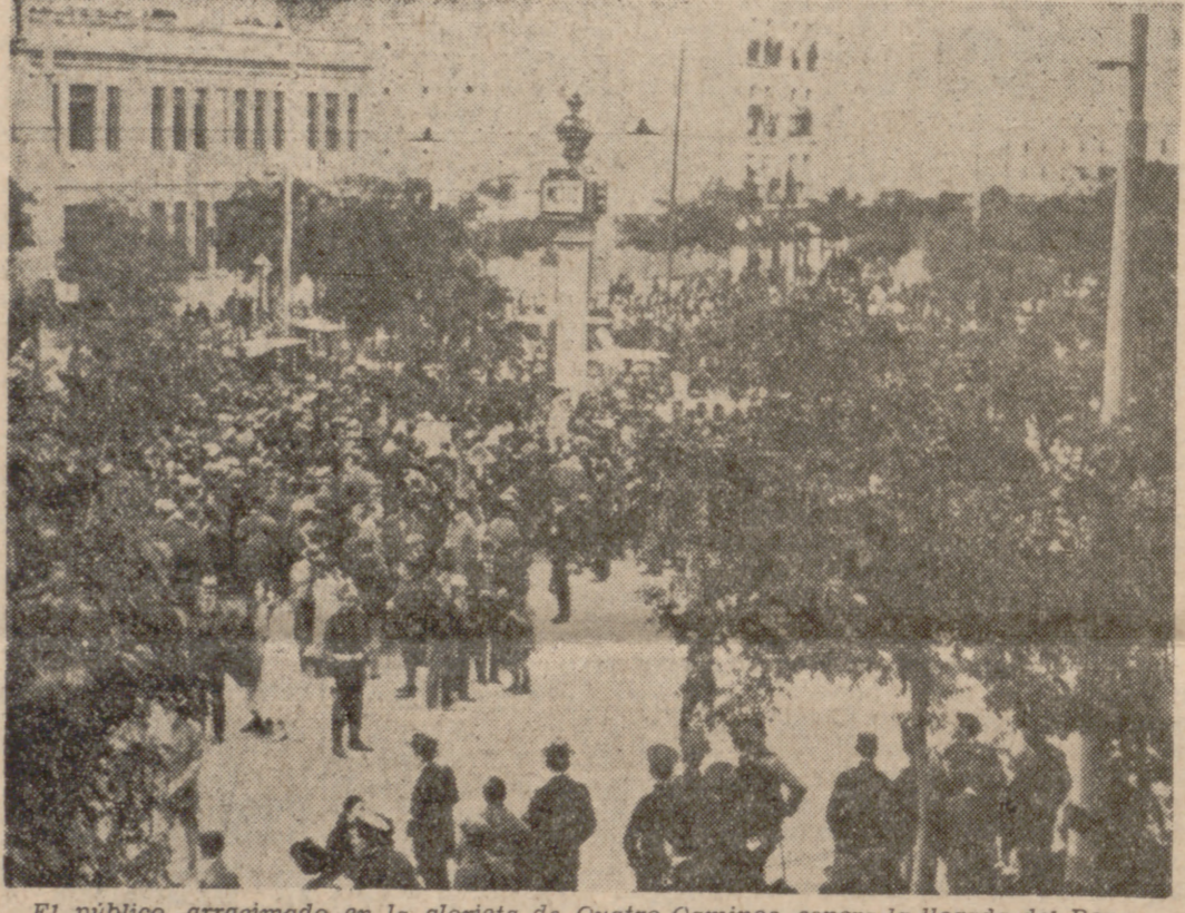
El público, arracimado en la glorieta de Cuatro Caminos, espera la llegada del Rey.