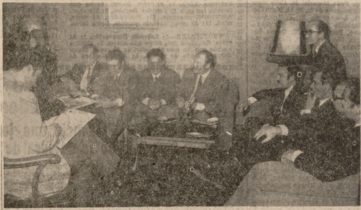
Un momento de la conferencia de Prensa.

«Valladolid es el puente de nuestra Organización hacia el norte del país»