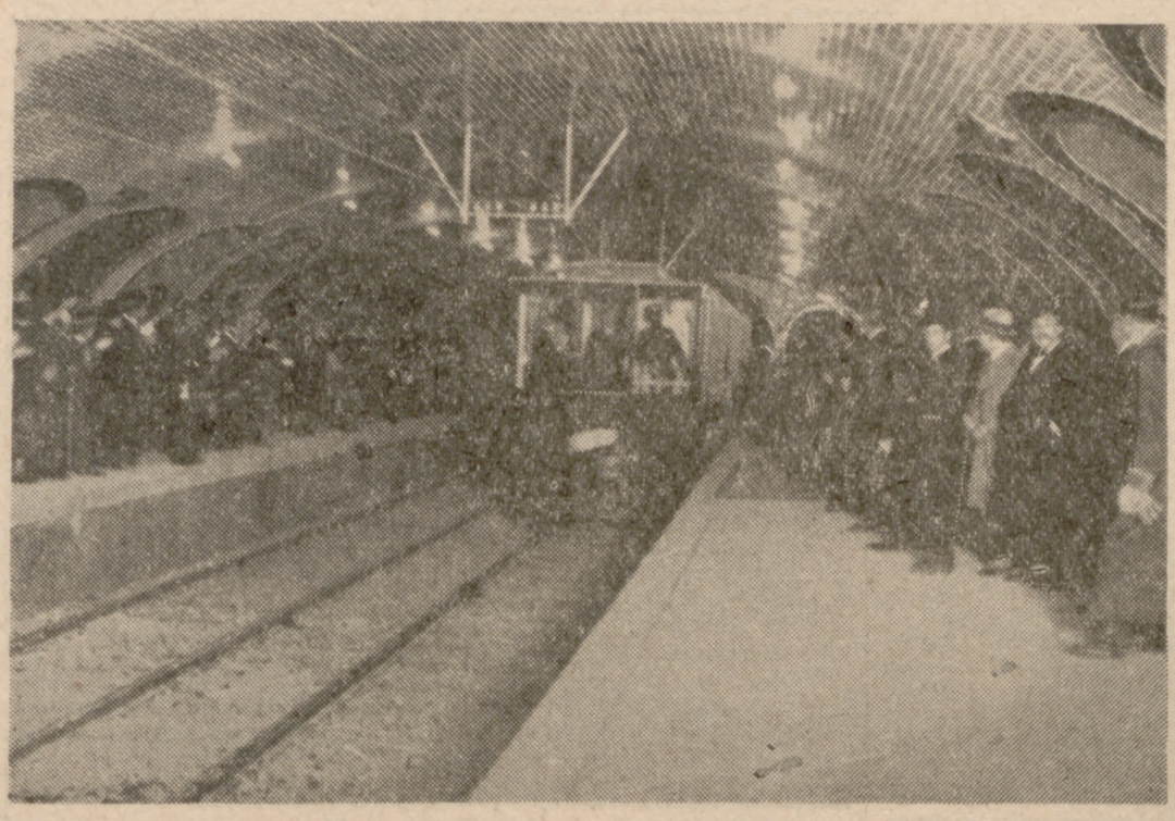
El convoy real emprende el viaje inaugural.

lecciones en la Escuela de Ingenieros de Caminos. Previo acuerdo de los tres amigos, se realizó el proyecto, y (Pasa a sexta página)