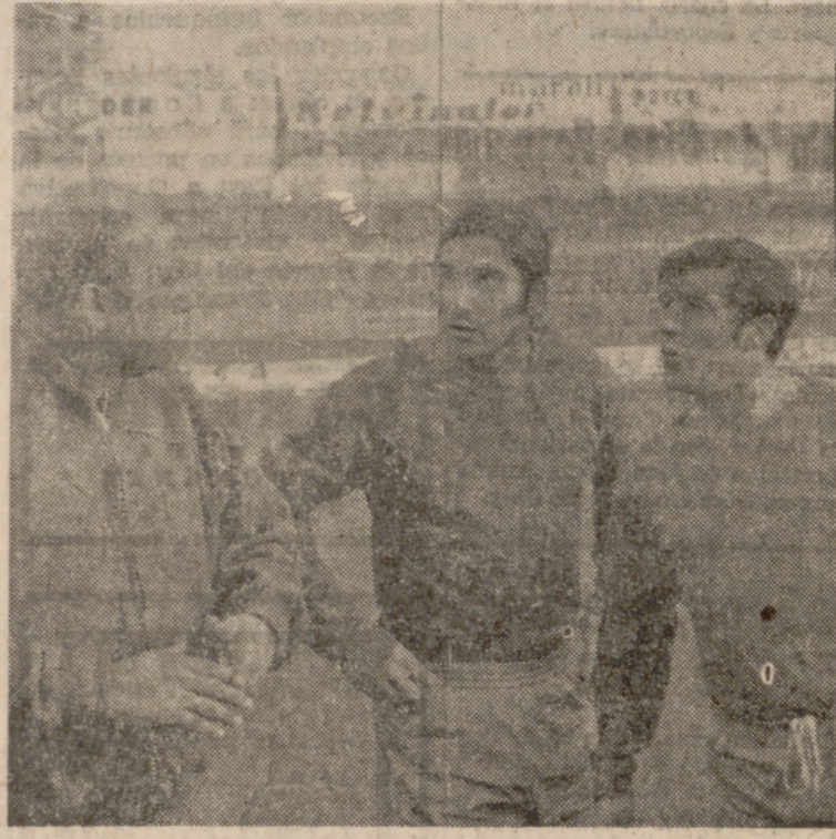
Saso, Docal y Román, en pleno entrenamiento.

En suma, que la visita del Salamanca, pese a su condición de colista, se presenta bastante amenazadora.