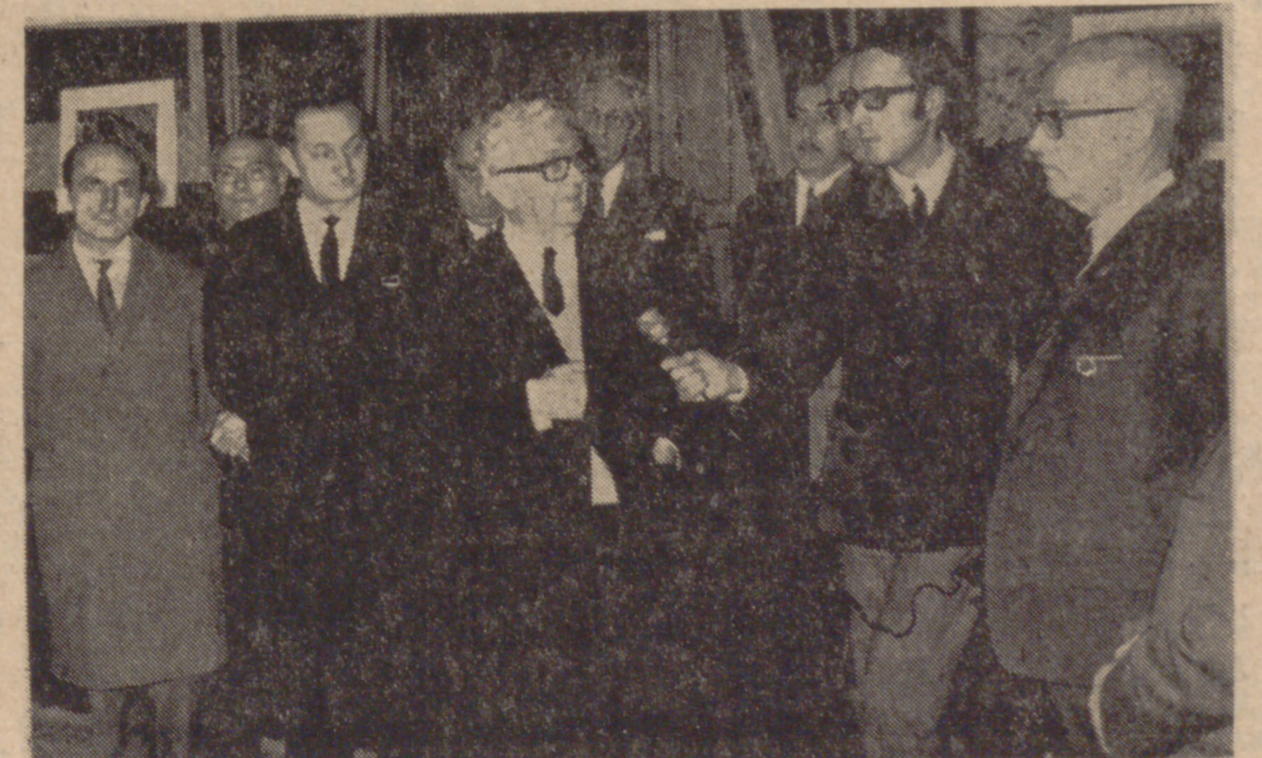
EN EL AYUNTAMIENTO