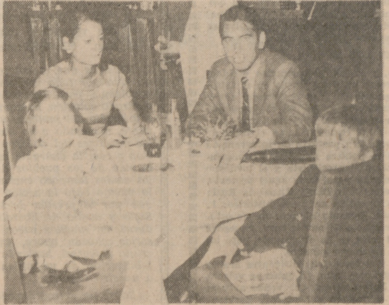
MADRID.—El tenista Manuel Santana, con su esposa e hijos, en el aeropuerto de Barajas, momentos antes de partir para Méjico, donde participará en los Juegos Olímpicos.