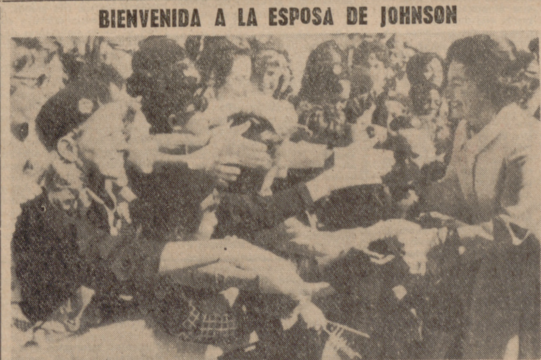
L.O. ISVILLE (Kentucky).—La señora Bird Johnson, esposa del Presidente de los Estados Unidos, recibe la bienvenida de cientos de jóvenes a su llegada al aeropuerto de esta ciudad para asistir a la campaña presidencial pro Humphrey.

LOS SERVICIOS DE CONTRAESPIONAJE, EN ACCION Poco a poco, los servicios de (Pasa a la página siguiente)