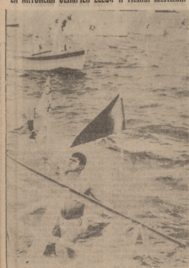
VERACRUZ (Méjico).—La antorcha olímpica, portada por un nadador mexicano, llega a tierra mejicana, después de ser trasladada a bordo de la fragata mejicana "Durango". Desde esta población, la antorcha iniciará la última etapa de su viaje hasta Méjico, capital, con motivo de la inauguración oficial de los Juegos Olímpicos.