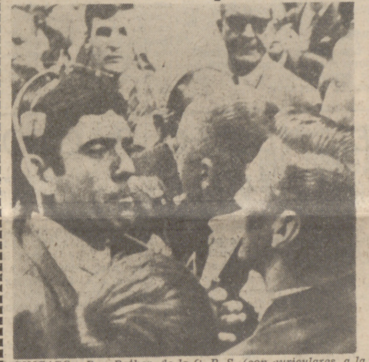
CHICAGO.—Dan Rather, de la C. B. S. (con auriculares, a la izquierda), está rodeado de agentes de seguridad, después de que trató de averiguar la razón por la cual un delegado de Georgia entraba en el Convention Hall con un estandarte de Georgia. Rather fue rodeado y, según se informa, golpeado en el abdomen y perdió el conocimiento.

LA POLICIA ATACÓ SIN PIEDAD A MANIFESTANTES Y PERIODISTAS