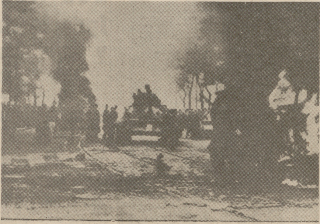
PRAGA.—Carros blindados y tanques soviéticos incendiados en una calle de Praga. La foto fue obtenida por un fotógrafo checo que huyó al Oeste.

Aunque rechacemos de plano la justificación que pretende Fidel Castro, es decente darle toda la razón en sus referencias a la campaña de Prensa con que se nos ha atosigado y hemos atosigado desde la primavera. Antes de que tal campaña se viera el cubano para arriar el ascua a su sardina había muchas mentes reflexivas que se preguntaban aterradas hasta qué punto