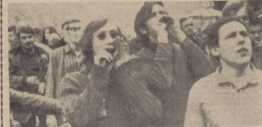
PRAGA.—La población checa abuchea a los oradores de las tropas ocupantes que, en la Plaza de San Wenceslao, informaban sobre los acuerdos de Moscú.

PRAGA.—La población ha quedado profundamente decepcionada por los resultados obtenidos en Moscú. El tráfico ha sido reducido en las ciudades y también parcialmente el trabajo y la asistencia escolar. Cientos de estudiantes, decepcionados y entristecidos, caminaron al edificio del Parlamento checo, bajo los fusiles del Ejército rojo, y se sentaron, con la cabeza inclinada, mientras los dirigentes checos los instaban a no provocar a las fuerzas de ocupación. Cinco camiones cargados de tropas soviéticas observaron la escena, pero no intervinieron, mientras los dirigentes estudiantiles hacían llamamientos a la resistencia pasiva. "No les damos una oportunidad para intervenir y decir al mundo que nuestro Gobierno no puede dirigir al país", declaró un dirigente estudiantil. Las organizaciones del partido comunista checo de todo el país se unieron a los estudiantes, al aprobar resoluciones, en el día de hoy, que declaraban que el acuerdo alcanzado en Moscú fue negociado con coacción y por ello no era válido. La gran mayoría de la gente preguntaba por qué el Presidente, Ludvík Svoboda, y el secretario del partido, Alexander Dubcek, habían hecho concesiones no aceptables para ellos. (Pasa a la página siguiente)