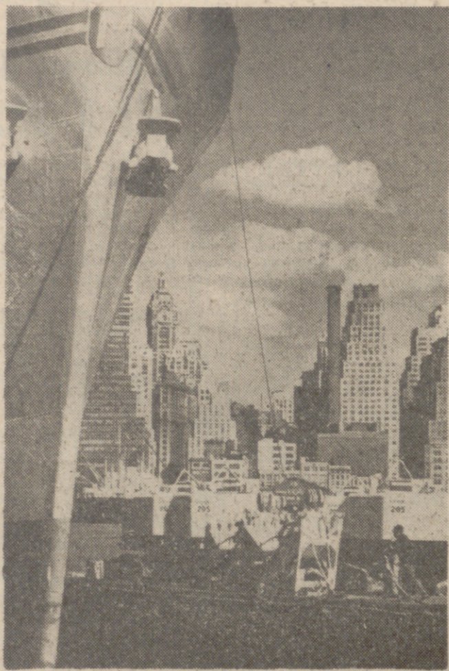
ANGULO DE NUEVA YORK.

Viaje de Madrid a Nueva York en un avión de una compañía americana. Fuede escoger entre cine, música y lectura: "La mitad de seis paniques", el concierto de Brandeburgo número no sé cuántos o revistas ilustradas surtidas. Se diría que el mar se ha congelado, en agosto, en una rizada lámina de acero. Quien no guste de la enalada de zanahoria, puede optar por la de tomate. Si el caballero las prefiere rubias, está de enhorabuena, porque tres de las cuatro azafatas son de aquel pelaje, con perdón. Un whisky cuesta medio dólar. De vez en cuando, muy de vez en cuando, nubes solitarias, islas perzozas perdidas en el cielo.