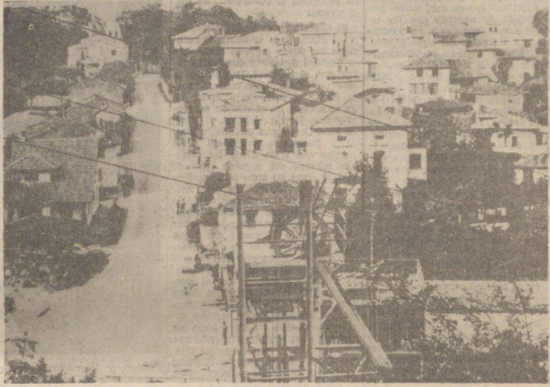
EL CENTRO URBANO DE CARAVIA SERA FRONTO. UNA SIMA MINERA

Todos los vecinos se han unido para hacer frente a la tragedia «Sabemos que la ley no nos ampara, pero lo intentaremos todo»