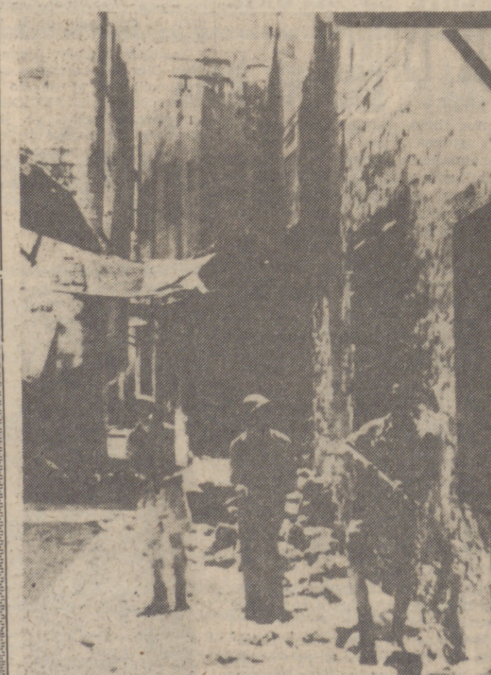
Soldados israelitas en una descubierta en zona ocupada por guerrilleros árabes.

1948, 1956, 1968: tres grandes victorias de Israel y tres graves derrotas de los árabes. Para los judíos, tres escalones hacia la hegemonía en el Medio Oriente; para los vencidos, tres batallas perdidas; pero la guerra sigue y, ¿quién se atreverá a predecir el resultado final? ¿Acaso no llegó a estar la Francia medieval en poder de los ingleses y, al final de la Guerra de los Cien Años, consiguió su independencia nacional?