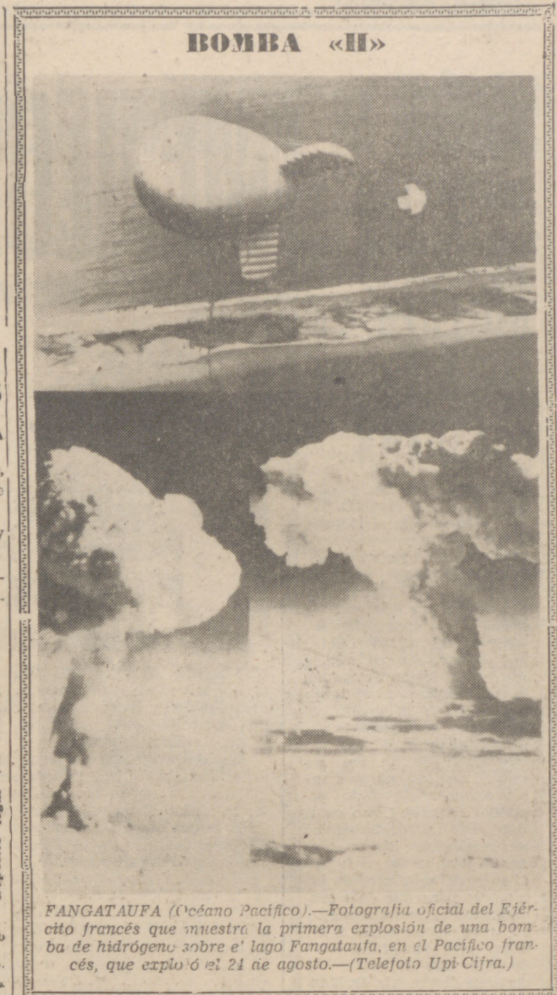
FANGATAUFA (Océano Pacífico).—Fotografía oficial del Ejército francés que muestra la primera explosión de una bomba de hidrógeno sobre el lago Fangatau, en el Pacífico francés, que explotó el 21 de agosto.—(Telefoto Upi-Cifra.)

La noticia no ha sido ratificada por la Jefatura de la II Región Aérea, con sede en Sevilla.