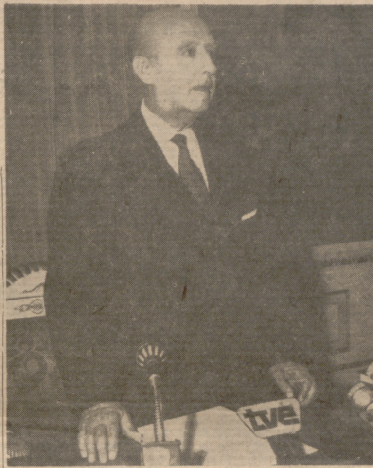
Depósito legal VA - 3 - 1964

El primer "Hombre del año" de la revista "Time" fue Charles A. Lindbergh, en 1927.