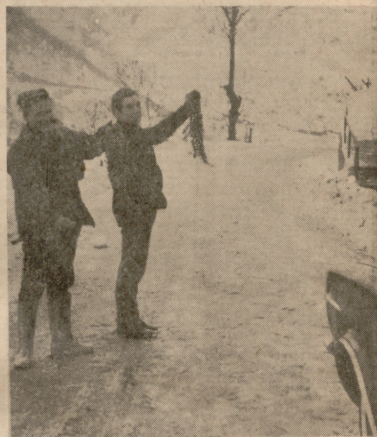
"Los días de mucha nieve no nos interesa alquilar: vendemos."

Aparecen en la carretera con la caída de los primeros copos de nieve: durante el resto del año son mineros, labradores, pastores, estudiantes, agricultores... Se levantan casi con el alba, cuando intuyen que va a cruzar el Puerto el primer automóvil. No son ni románticos ni caritativos: son especuladores, industriales de la carretera. Se aprovechan de las dificultades de los conductores: negocian fríamente con la necesidad, a veces acuciante, de cruzar la puerta de Asturias: son los profesionales del auxilio en carretera, los cadeneros de Pajares.