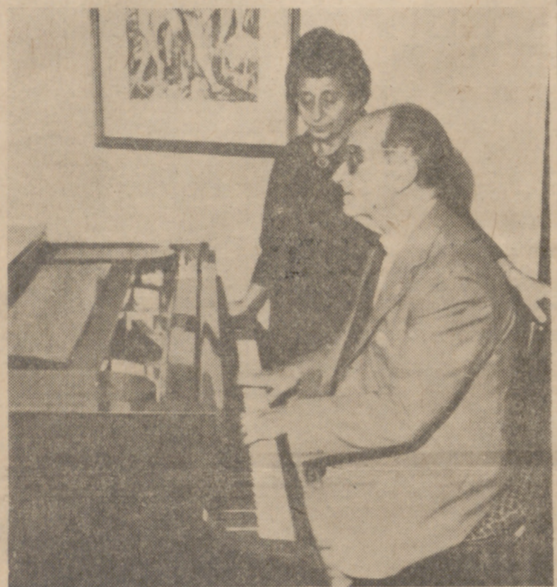
Se ha despertado un racionalismo musical tremendo en todos los países.

A la guitarra ha ofrecido buena parte de producción: "Zarabanda lejana", "En los trigales", "Entre olivares", "Por tierras de Jerez", "Tiento antiguo", "Bando de la meseta", "Junta al Generalife", "Exercitacion et danse" (Homage a Manuel de Falla. Primer premio de la R. T. F. "Coupe de la guitarra 1961"), "Sonata Gocosa", "Trois petites pièces" (Ya se van los pastores - Por caminos de Santiago - Pequeña sevillana).