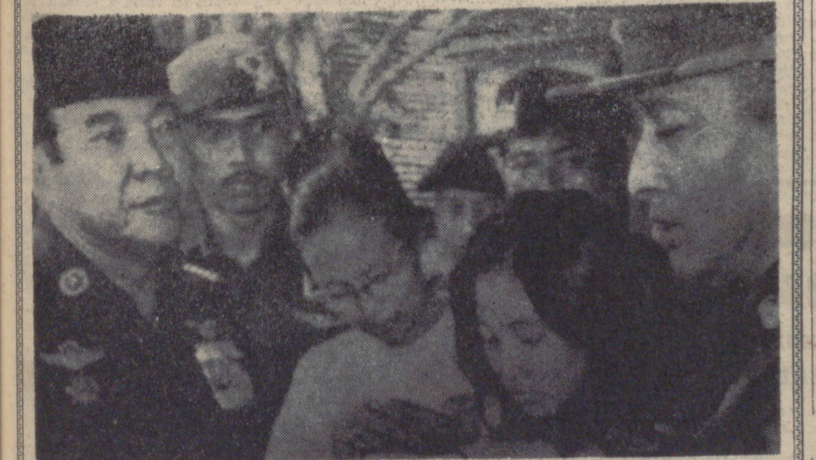
YAKARTA.—El Presidente Sukarno y el teniente general Suharto, hablando a los periodistas después de su reunión en Palacio de Estado. Fue decidido cambiar el nombre del Comando Crush Malasia por el más pacífico de "Alto Mando", de acuerdo con la nueva táctica de las relaciones pacíficas con Malasia.

U Thant declaró: "Creo en la democracia, en la dignidad humana, en la libertad de conciencia, pero esta confianza en la superioridad de la democracia no me ciega hasta el punto de no ver que millares de personas no están de acuerdo conmigo. También creo que el budismo es una gran religión, una religión superior, pero eso tampoco me ciega para no ver que hay millares de personas que no están de acuerdo conmigo". U Thant terminó su discurso refiriéndose a la diferencia existente entre los países orientales y occidentales.