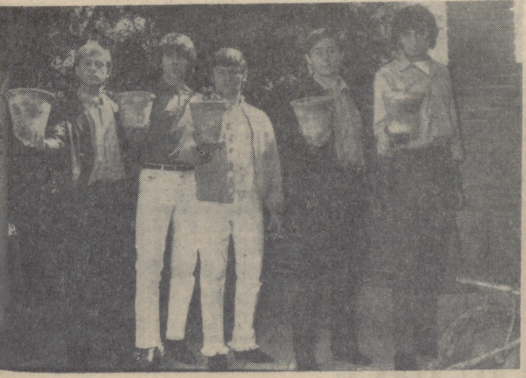
"Los Continentales", como otros muchos cantantes, se pasan al cine. A mediados de septiembre empezarán el rodaje de "Monqueteros del siglo XX", un film con visos musicales, que se rodará en Málaga, Marbella, Barcelona, Salou y otras capitales típicamente veraniegas. Esperamos que en esta nueva faceta el popular conjunto madrileño alcance tantos éxitos como en el mundo de la canción.