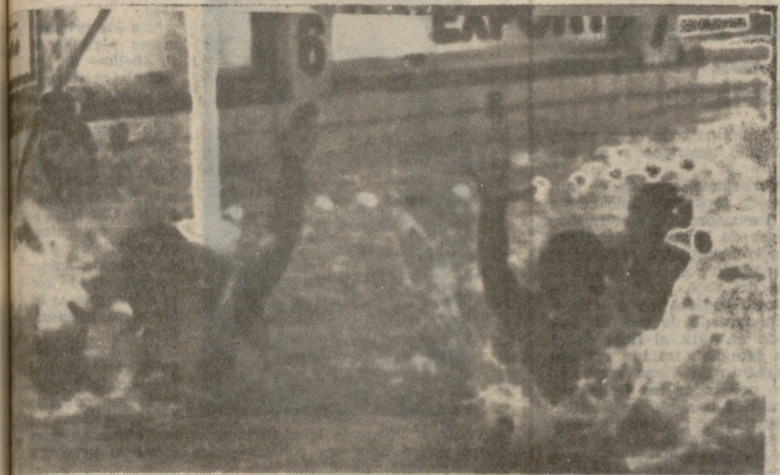
El primer gol español en el encuentro de waterpolo España-Francia...