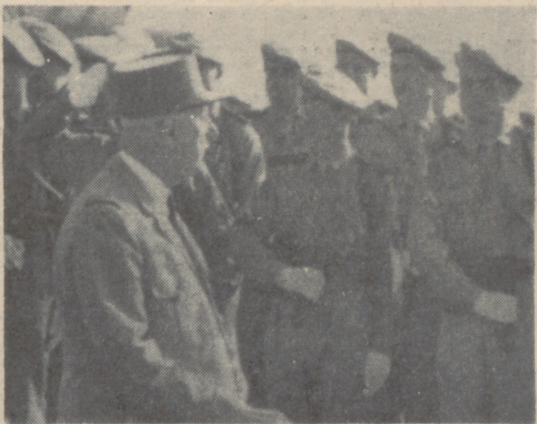
PARIS.—Seguido por Georges Pompidou, primer ministro francés, y Pierre Messmer, ministro francés del Ejército, el Presidente Charles de Gaulle saluda a la guardia de honor formada antes de salir para su viaje de diecisiete días, en el aeropuerto de Orly. La primera etapa del viaje del general ha sido Djibouti (costa de la Somalia francesa).

LISBOA, 26. (Efe-Reuter).—A LAS SIETE (HORA ESPAÑOLA) SE SINTIÓ UN LIGERO MOVIMIENTO SISMICO EN LOS ALREDEDORES DE LISBOA. NO SE SABE AUN SI EL TERREMOTO HA PRODUCIDO VICTIMAS O DANOS.