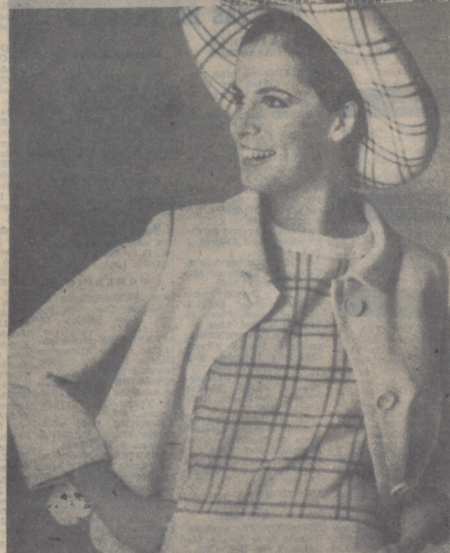
Los cuadros dominan este año en todos los tejidos lanzados por la industria francesa. Con moda "op-art" o sin ella, las colecciones de los modistas ofrecen toda una sinfonía de ajedrez en los colores más variados y sin límites a la hora de la confección. En nuestras fotografías, conjunto de vestido y abrigo en satén de lana gris con finos cuadros blancos y pechera blanca para ambas piezas. Finalmente, un traje primaveral, muy juvenil, en franela rosa con cuadros grises.