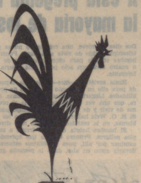
el gallo ROJO

Carretera de Madrid, km. 168 (N-403) Teléfono 39 - MOJADOS (Valladolid)