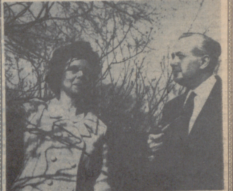
LONDRES.— Tiempo primaveral en Londres en la fecha en que el primer ministro, Harold Wilson, cumple cincuenta años. Con su esposa Mary, pasea por los jardines del número 10 de Downing Street.