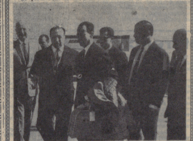
MADRID.— El mayor general Rahman Aref, jefe del Estado Mayor del Ejército iraquí, a su llegada a Madrid procedente de Casablanca, donde asistió a las fiestas del Trono. Permanecerá en Madrid cuatro días.