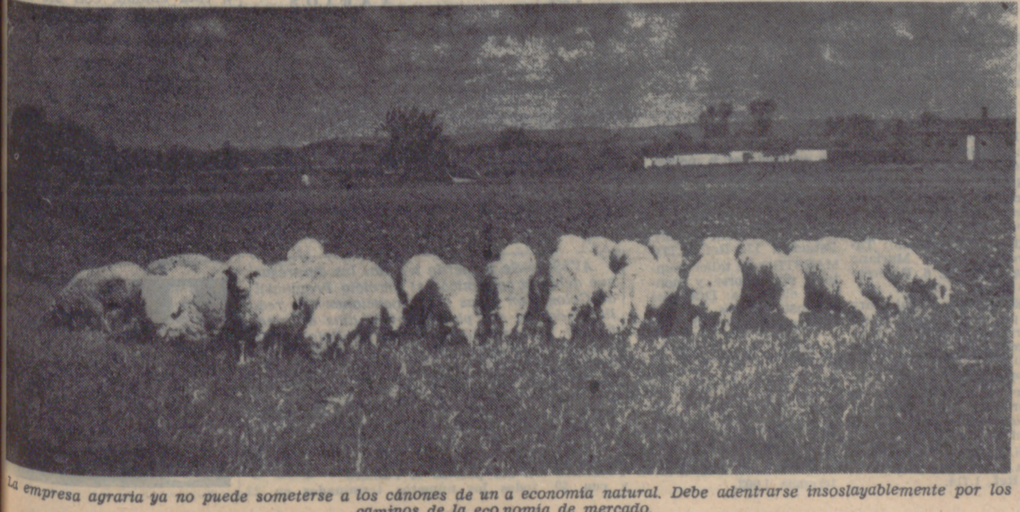
La empresa agraria ya no puede someterse a los cánones de una economía natural. Debe adentrarse insoslayablemente por los caminos de la economía de mercado.