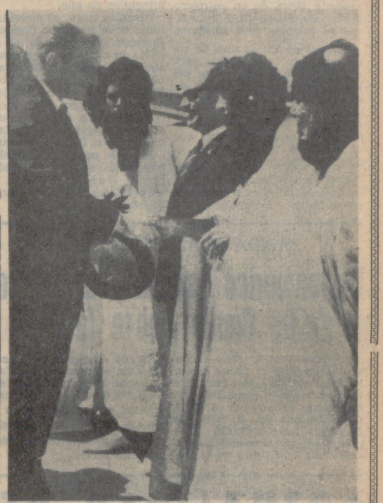
EL AAIUN (Sahara).—Procedente de Canarias llegó a esta ciudad el ministro de Asuntos Exteriores, don Fernando María Castiella. En la fotografía, el señor Castiella saludando a los notables "saharíes".—.