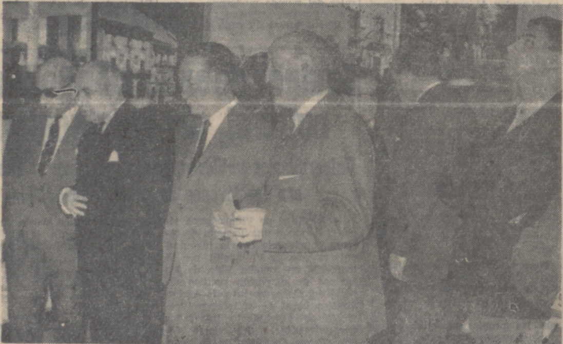
El Presidente del Consejo de Administración de la Caja de Ahorros visita acompañado de los delegados de Información y Turismo de Vizcaya y Valladolid, la exposición «Recursos Turísticos de Vizcaya».

Pertenece a la campaña «Conozca usted España», del Ministerio de Información y Turismo