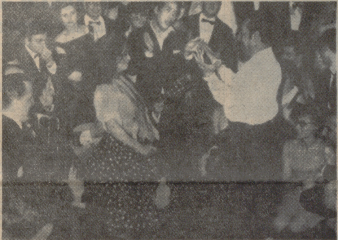
PARIS.—La famosa bailarina flamenco española "La Chunga" ha actuado en un club privado parisiense. Como es costumbre, el público asistente se sienta en el suelo, no dejando más que dos metros cuadrados para que "La Chunga" realice sus bailes.