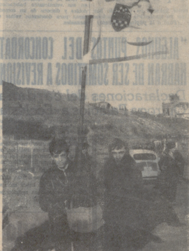
PAMPLONA.—Como en años anteriores, se ha celebrado la peregrinación hacia Javier para tomar parte en la concentración del santo misionero navarro. Acudieron miles de peregrinos, que hubieron de superar lluvia y viento en su recorrido.