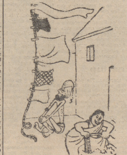
LA COLADA DEL FAKIR

HORIZONTALES. — 1: Interjección Descendera. 2: Asignación de día, hora y lugar para tratar algo. Insignias de los nobles. 3: Al revés, letra griega. Detrás de. Artículo 4: Espasmos. Escuchabaldas. 5: En plural y fonéticamente, hierba segada y seca. 6: Al revés, donen. Cierta polo. 7: Periodo de tiempo. Domadura de potros. 8: El que cuida del ganado. Voz con que se expresa un ruido. 9: Terminación verbal. Espacio de tierra que ocupa un edificio. Familiar y repetido, hermana. 10: Sitio poblado de pinos. Parte del río próxima a su desembocadura al mar. en plural. 11: Hueco del cañón. Letras de creer. VERTICALES. — 1: Pino muy resinoso de Méjico. Interjección. 2: Roedor parecido al ratón, pero más grande. Letras de pinar. 3: Conjuncción latina. Tienta algo encorvada. Símbolo físico. 4: Letras de ata. Cierta número. Al revés, familiar, y repetido, madre. 5: Letra griega. Pondrá fecha. 6: Al revés, pariente. Hermana. 7: Uniros. Nota musical. 8: Terminación verbal. Instrumento musical. Desinencia verbal. 9: Al revés, nota. Cierta planta comestible. Número romano. 10: Raídas. Quitar la vida. 11: Tueste. Tostase. (SOLUCION AL CRUCIGRAMA EN LA SECCION DE ANUNCIOS ECONOMICOS.)