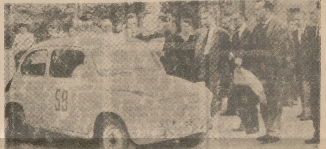
LA LLEGADA DE UNO DE LOS PARTICIPANTES

asfalto, ya que uno de los coches derrapó en la curva en la que se enfilaba la recta de la meta, poniendo en peligro también a los numerosos espectadores, que a pesar del mal tiempo se habían congregado a lo largo del circuito.