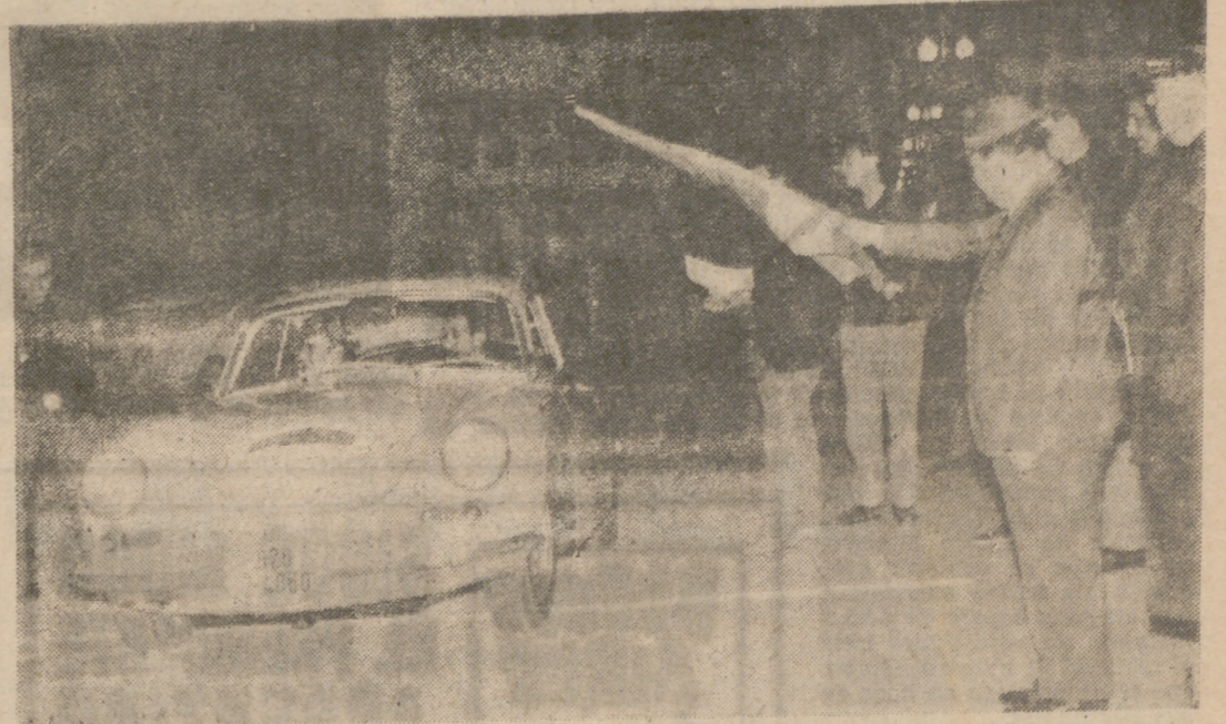
EL SEÑOR ALCALDE DA LA SALIDA AL PRIMER COCHE DEL III RALLYE