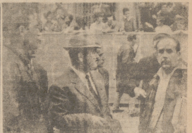
Momento en el que se acuerda la suspensión del circuito de velocidad, debido a la lluvia y mal estado del circuito.

asfalto, ya que uno de los coches derrapó en la curva en la que se enfilaba la recta de la meta, poniendo en peligro también a los numerosos espectadores, que a pesar del mal tiempo se habían congregado a lo largo del circuito.