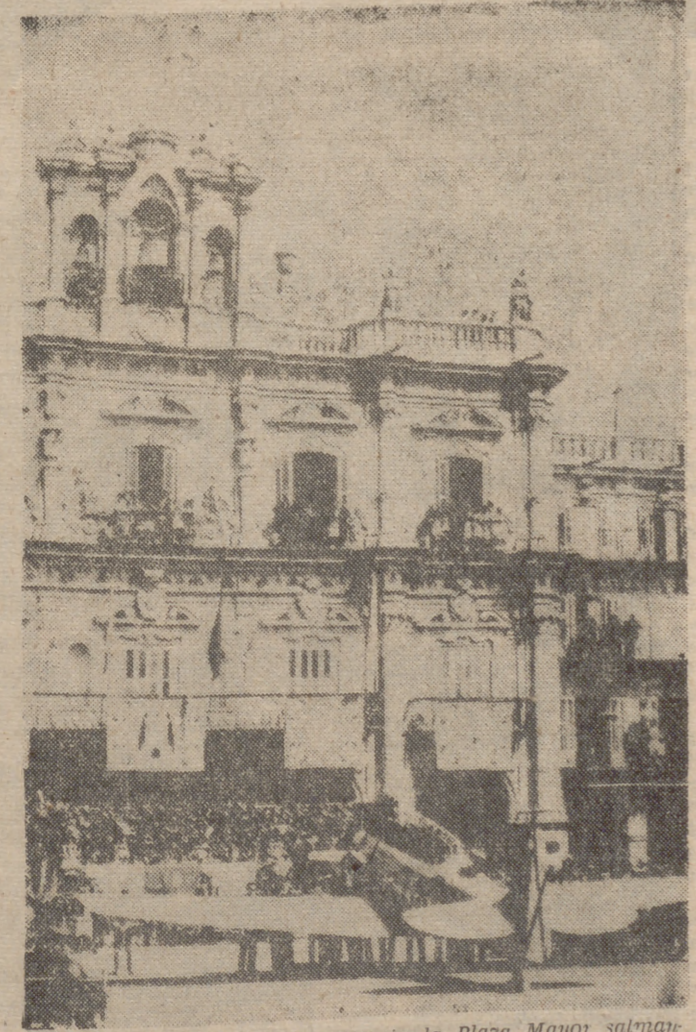
SALAMANCA.—Aspecto que ofrece la Plaza Mayor salmantina durante el homenaje dedicado a la Escuela Básica de Pilotos de Matacán, con motivo de haberse cumplido los cien horas de vuelo por ese Centro. Un avión tipo "T-6", que mil horas de vuelo por ese Centro, fue montado en la ha servido estos años para la enseñanza, fue montado en la plaza. El Ayuntamiento de Salamanca ha concedido la Medalla de Oro de la Ciudad a la citada Escuela Básica. Los actos fueron presididos por el jefe de la Región Central Aérea, teniente general González Gallarza; el general Prato Castro, director general de Instrucción, y el capitán general de la VII Región Militar, que llegó expresamente de Valladolid.