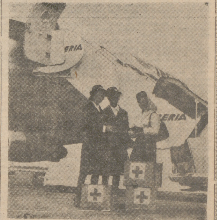
MADRID.—Un momento del acto simbólico de la formal entrega de un cargamento con un peso total de cien kilos de plasma sanguíneo por el personal femenino de la Cruz Roja Española a la tripulación del avión de Iberia, donde será trasladado al Brasil y para las víctimas de los desastres del Estado de Paraná.