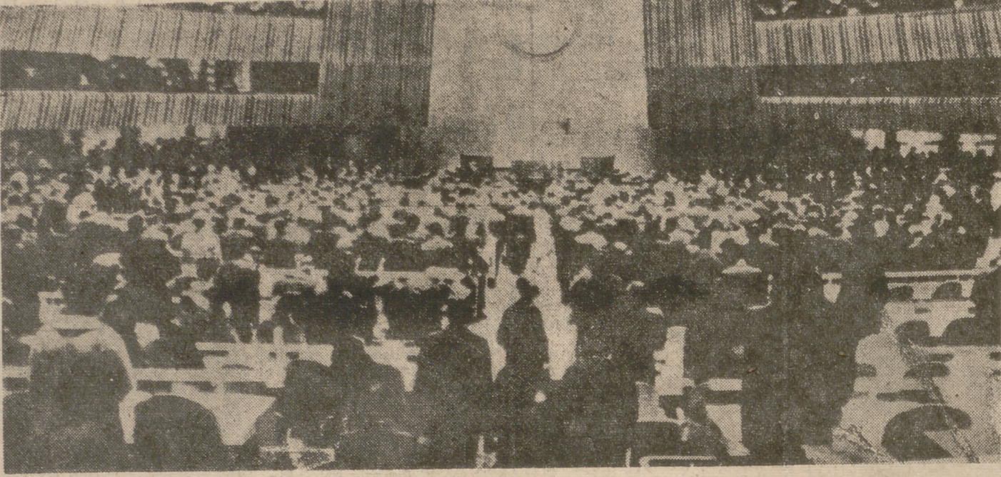
Como es costumbre en la sesión de apertura de la Asamblea General, los representantes, puestos en pie, guardan unos minutos de silencio. Poco después comenzaría la actividad de la Organización, que tratará acerca de ochenta y dos casos que figuran en la agenda de la Asamblea. Gromyko ha propuesto que en ella se celebre una Conferencia cumbre para tratar sobre el desarme general.