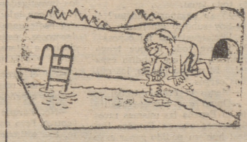
PISCINA EN EL POLO