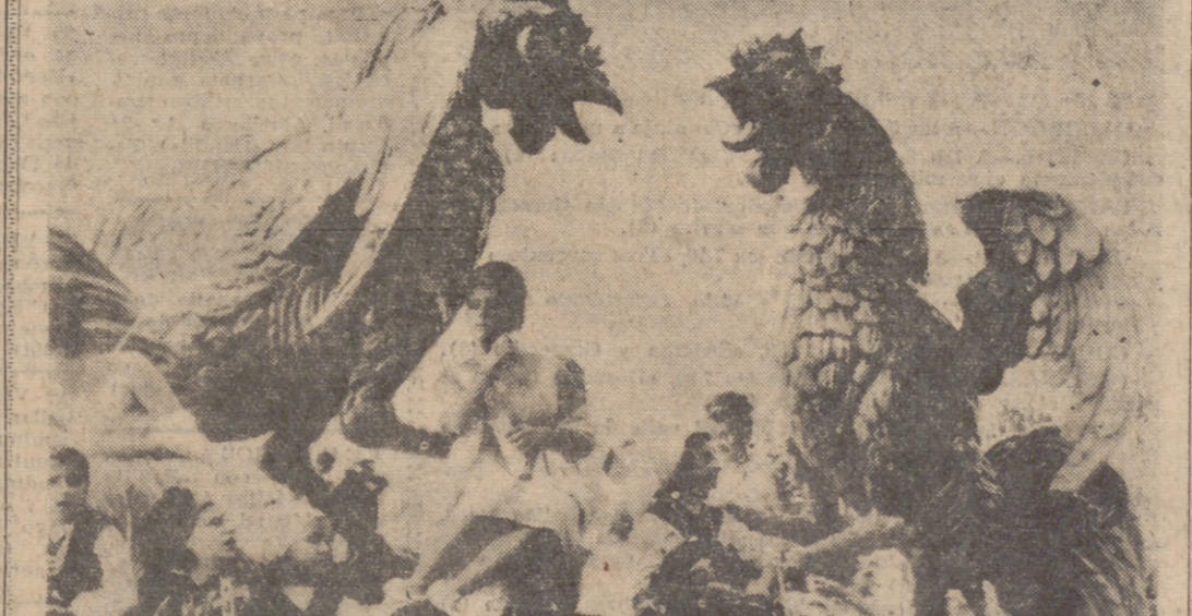
OVIEDO.—He aquí una de las quince carrozas que participaron en el ya tradicional "Día de América en Asturias", uno de los actos más bellos y emotivos de las fiestas en honor de San Mateo, Patrón de la ciudad. También participaron grupos folclóricos de España, Portugal y Francia y varias bandas de música. Se calcula en 150.000 personas las que presenciaron este magno desfile.