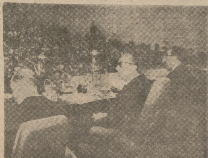
MADRID.—Con asistencia del ministro de Trabajo, señor Romeo Gorria, ha sido clausurado el XIV Congreso Internacional de Medicina del Trabajo, que ha venido celebrándose en el salón de sesiones de la Casa Sindical.

Se ha revelado que, como cuestión advacente, las conversaciones probablemente incluyen la cuestión del primado de Hungría, cardinal Josef Mindszenty, que se encuentra exiliado en la Embajada norteamericana en Budapest desde el levantamiento anticomunista húngaro de 1956.—Efe.