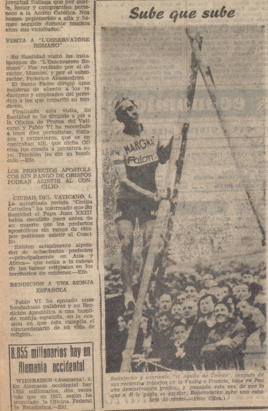
Sube que sube

El ambiente de las elecciones es de auténtico interés y entusiasmo.—Cifra.