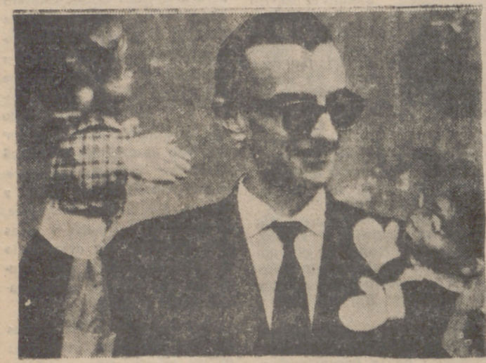
El guiñol y las marionetas, espectáculo favorito de los niños en la televisión.