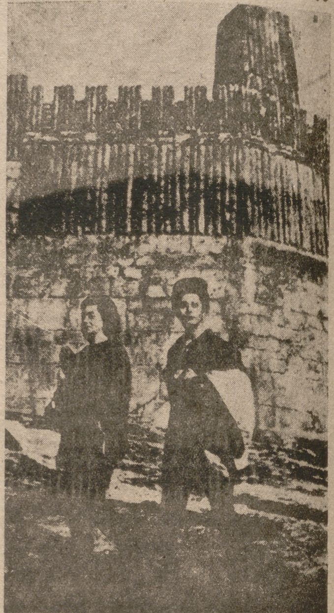
Con atuendo deportivo, Sofia Loren aparece durante un paseo ante las murallas de un castro romano que se ha levantado en Valsain, donde se rueda actualmente "La caída del Imperio romano".