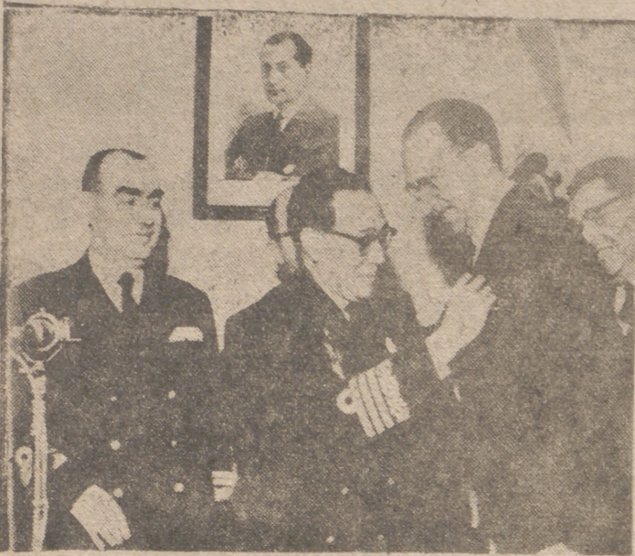
En la Escuela Oficial de Periodismo se celebró la clausura de un curso de tecnología para oficiales de la Marina. El almirante Nieto Antúnez impone la Medalla del Mérito Naval al director de la Escuela.