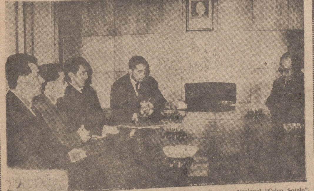
El ministro de Industria, don Gregorio López Bravo, ha visitado la Empresa Nacional "Calvo Sotelo", en esta ciudad. Después de recorrer las instalaciones, el Ministro celebró una reunión con los Jurados de esta Empresa.