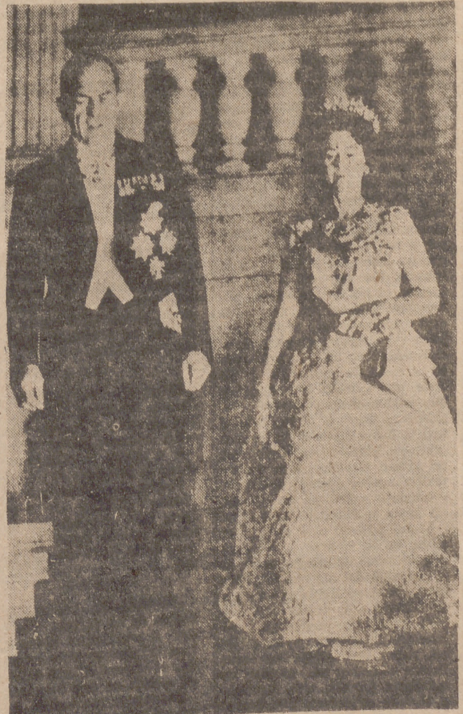
El rey Pablo y la reina Federica de Grecia

"ANA MARIA HA TENIDO QUE 'SALTAR' SOBRE LA SOLTERIA DE SUS HERMANAS."