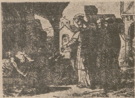
SAN GUNDRANO, REY Y CONFESOR

Dirán ustedes lo que quieran del tiempo y sus veleidades; pero, saliendo fuera de la ciudad —ahora, a pocos pasos de la calle de Santiago— el campo es una bendición. Conforta cruzar cualquiera de los cuatro puentes —ahora vamos con el quinto y no hay quinto malo— y pasear cerca de las huertas. Los almendros están maravillosos, cuajados de flores y a pesar de las últimas heladas no les ha sucedido nada malo. Dan ganas de traer a casa un árbol o, por lo menos, una rama para adornar la mejor habitación de la casa. Días tan antipáticos como ayer son los que traen tantos encantos seguidos, y estuvo más cerca del invierno que de la primavera. Los sembrados siguen hacia arriba y, lo que es mejor, sin gran forraje y altura, «Tutti ya beno».