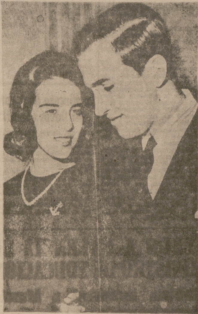
El príncipe Constantino y la princesa Ana María, prometidos oficialmente.

El mando aliado de la OTAN acababa de invitar al príncipe a visitar las instalaciones militares de Centroeuropa. Grecia forma parte del Tratado del Atlántico Norte y Constantino, como ofi-