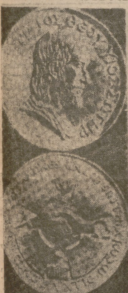
En Utrecht (Holanda) se ha acuñado esta medalla conmemorativa del Concilio Vaticano. Una de sus caras muestra el perfil de Cristo.