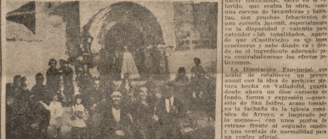
"Procesión de San Isidro", cuadro premiado por la Diputación Provincial.