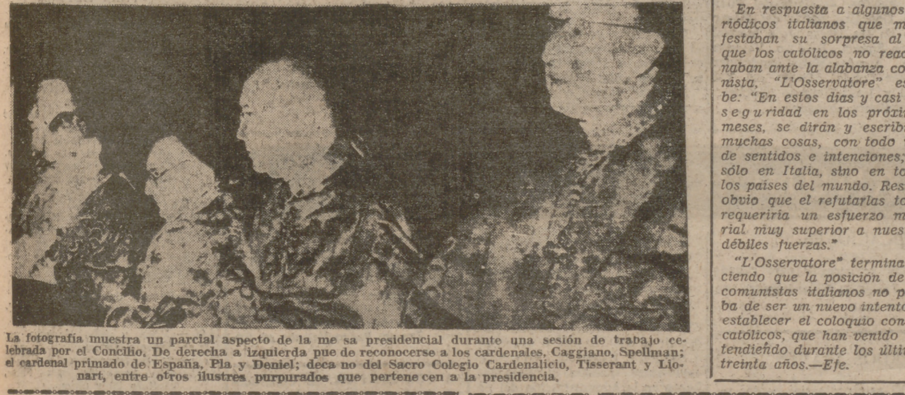
La fotografía muestra un parcial aspecto de la mesa presidencial durante una sesión de trabajo celebrada por el Concilio. De derecha a izquierda se ve de reconocerse a los cardenales, Caggiano, Spellman; el cardenal primado de España, Pla y Daniel; deca no del Sacro Colegio Cardenalicio, Tisserant y Lignani, entre otros ilustres purpurados que pertenecen a la presidencia.