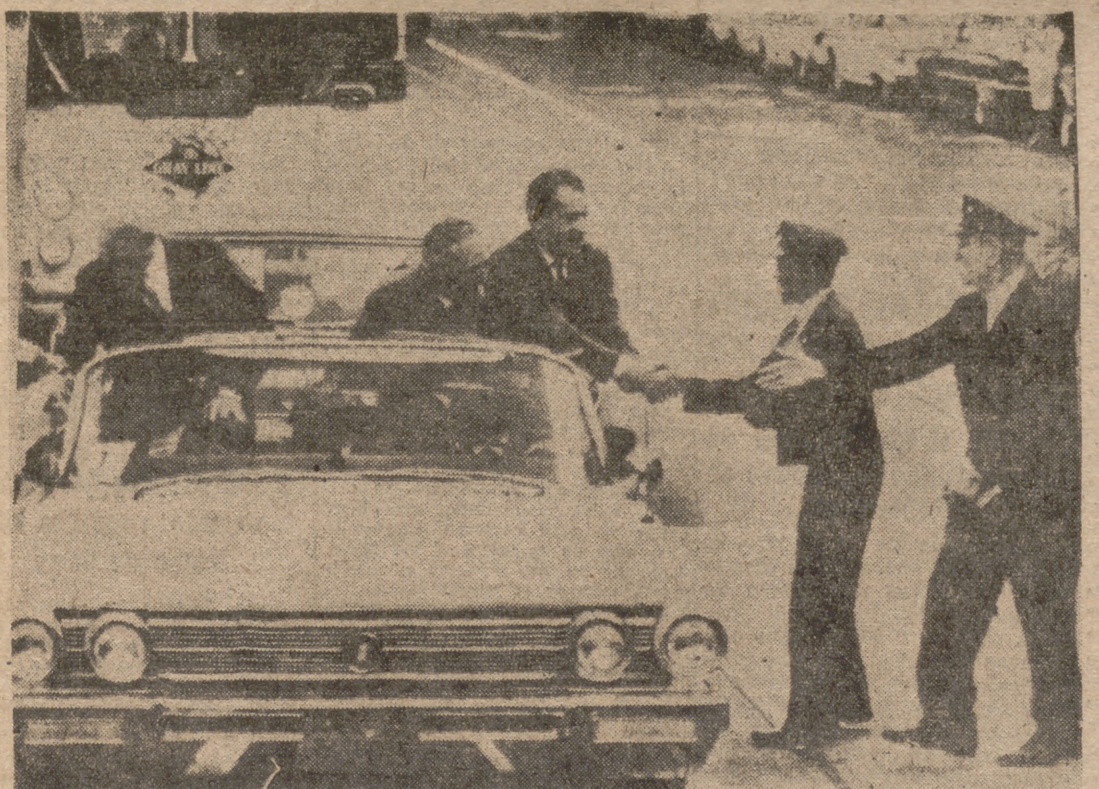
SAN FRANCISCO.—Richard Nixon ha comenzado su campaña electoral para la gobernación del Estado de California. En la foto, durante un desfile de propaganda, Nixon (a la derecha), acompañado del Alcalde de San Francisco, estrecha la mano de dos tranviarios que detuvieron a su paso su vehículo...