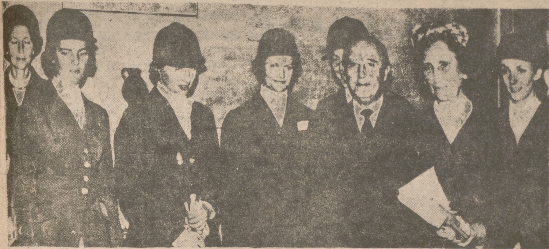
En las pistas del Club de Campo, de Madrid, se corrió la final del Campeonato de Amazonas, Copa de Su Excelencia el Generalísimo, El Caudillo y su esposa, durante el descanso de la prueba, con las amazonas participantes.