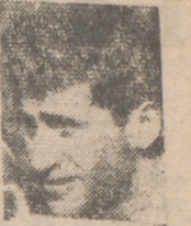
—El equipo español que participa en la Vuelta a Colombia tuvo una actuación destacada en la primera etapa. Alcanzó al final de la misma el quinto puesto por equipos. Los técnicos achacan a la falta de ambientación de los corredores españoles este regular comportamiento de los hispanos.

Para presenciar el debut del jugador español, en un partido de poco compromiso, se organizaron trenes especiales y autocares. Y el público acogió con aplausos cada intervención del exrobilánico, que por cierto no estuvo nada afortunado, quizá influenciado por la gran expectación que su debut había despertado. No obstante, los seguidores del Torino confían en su gran clase y velocidad.