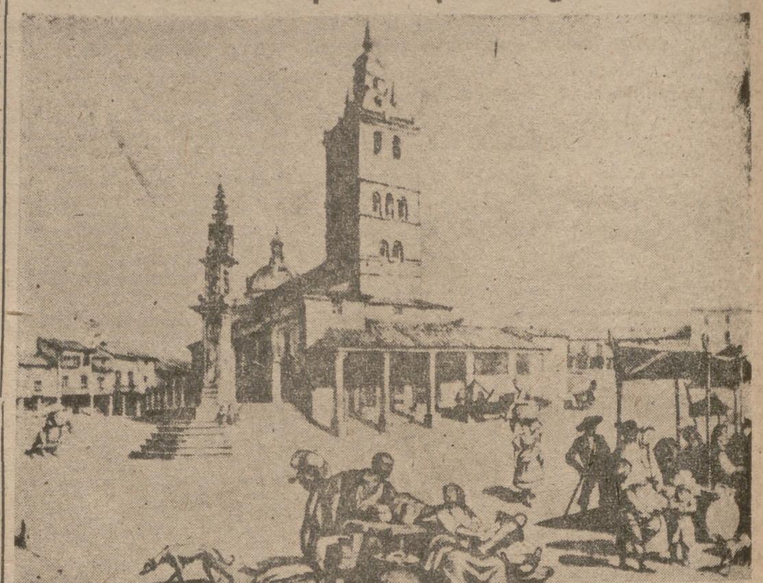
Plaza Mayor de Villalón de Campos, con el "rollo" y el buen fondo de la iglesia, con mucha anecdota decorativa.

Castiivejo, Premio de Pintura del "Día de la Provincia" Es un artista jugoso que conoce muchas técnicas El Aero Club y la Cámara de Industria y Comercio están decorados por el pintor galardonado