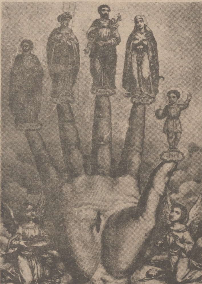
Una de las llagas de Nuestro Señor.