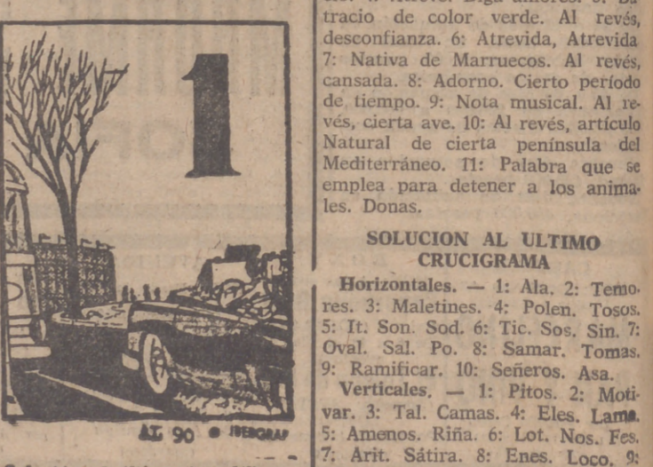
Solución al último jerooglífico: COMO ROSCONES

SOLUCION AL ULTIMO CRUCIGRAMA Horizontales. — 1: Ala. 2: Temores. 3: Maletines. 4: Polen. Tosos. 5: It. Son. Sod. 6: Tic. Sos. Sin. 7: Oval. Sal. Po. 8: Samar. Tomas. 9: Ramificar. 10: Señeros. Asa. Verticales. — 1: Pitos. 2: Mofivar. 3: Tal. Camas. 4: Eles. Lamá. 5: Amenos. Rifa. 6: Lot. Nos. Fos. 7: Arit. Sátira. 8: Enes. Loco. 9: Sesos. Más. 10: Sodipar. 11: Sa. nos.