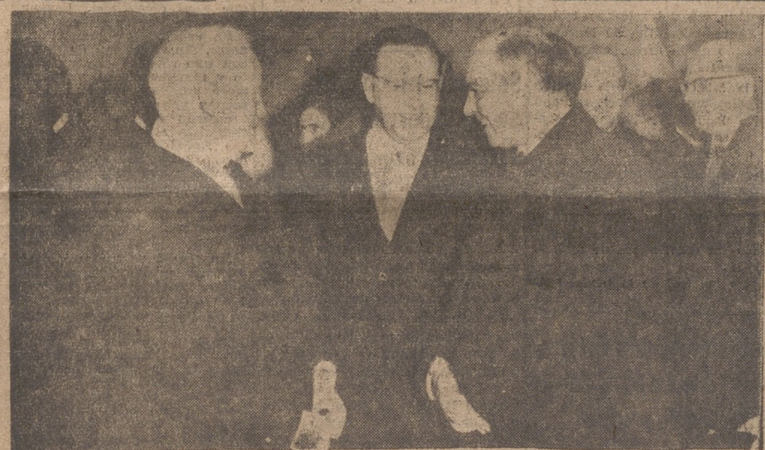
Durante su breve estancia en el aeropuerto de Barajas, en su viaje a Liberia, Guinea y el Senegal, el presidente de la República Federal alemana, doctor Heinrich Lübke, conversa con el ministro secretario general del Movimiento, señor Solís Ruiz, y otras personalidades.