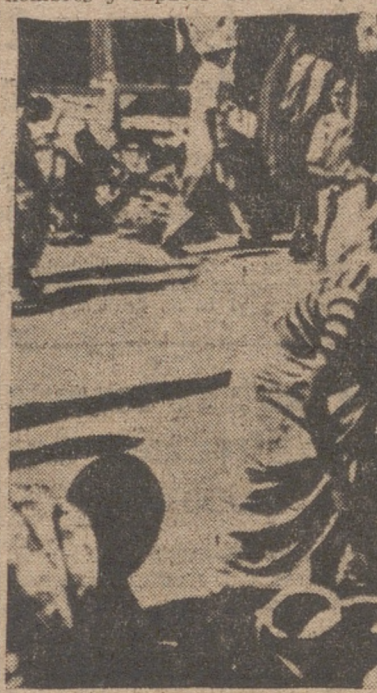
GOA.—MERCADO DE BARROS.