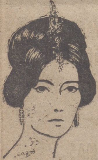
Peinado de inspiración inca. Una diadema elevada hace destacar los ojos, delicadamente alargados con un trazo de lápiz marrón.

Este tiempo que vivimos es el más agradable del año, el de más dulce intimidad, el que nos hace pensar en nuestros amigos y dedicarnos un recuerdo con el deseo de que sean felices.