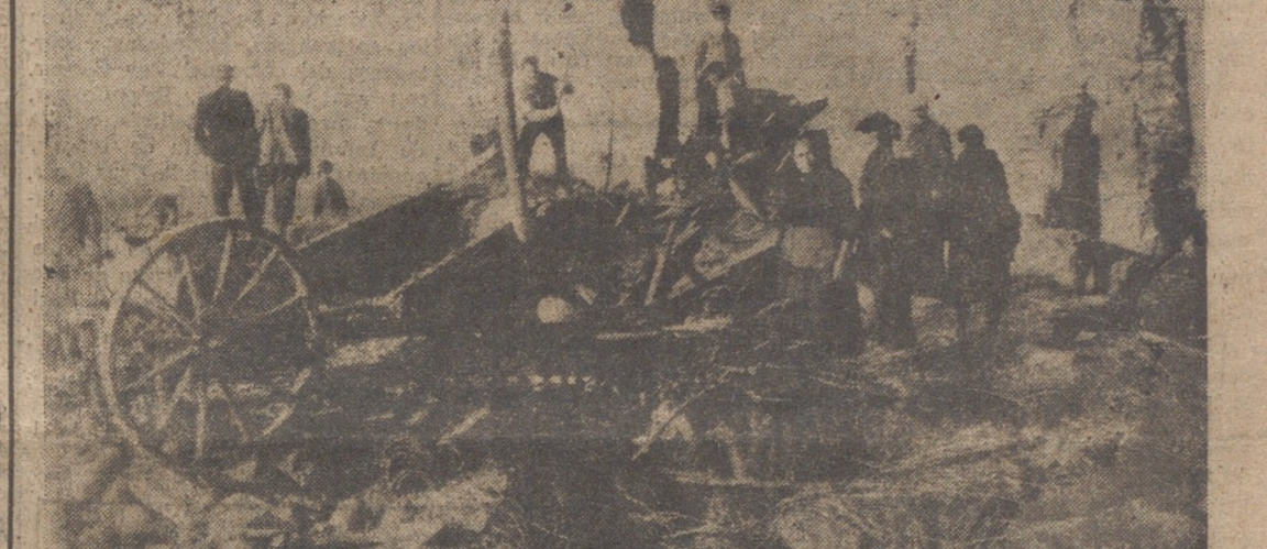
El Valderaduey ha podido con el esfuerzo del hombre, arrasando el campo y atacando el casco urbano con extraordinaria violencia. Se produjeron numerosos derrumbamientos y han quedado sin hogar multitud de humildes familias campesinas. Los daños causados se elevan a varios millones de pesetas, y la situación económica en que han quedado los habitantes de Castroverde es extremadamente crítica. La fotografía recoge la rebueta, entre las ruinas, de lo que en ellas puede aún haber de valor. (Publicamos amplia información en nuestras páginas interiores).

Viviendas desalojadas en las márgenes del Duero en Zamora