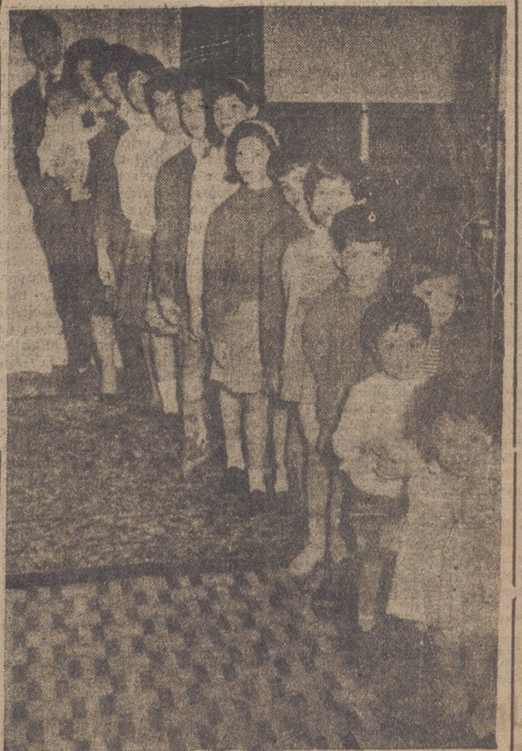
Con el benjamín, en brazos de su madre, la familia aparece fotografiada en escala.