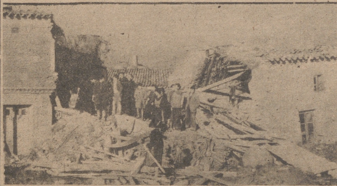
OTRO ASPECTO DE LOS HUNDIMIENTOS EN CASTROVERDE DE CAMPOS

El campo arrasado y toda la cosecha perdida. Eficaz y ejemplar ayuda de Becilla y Barcial de la Loma